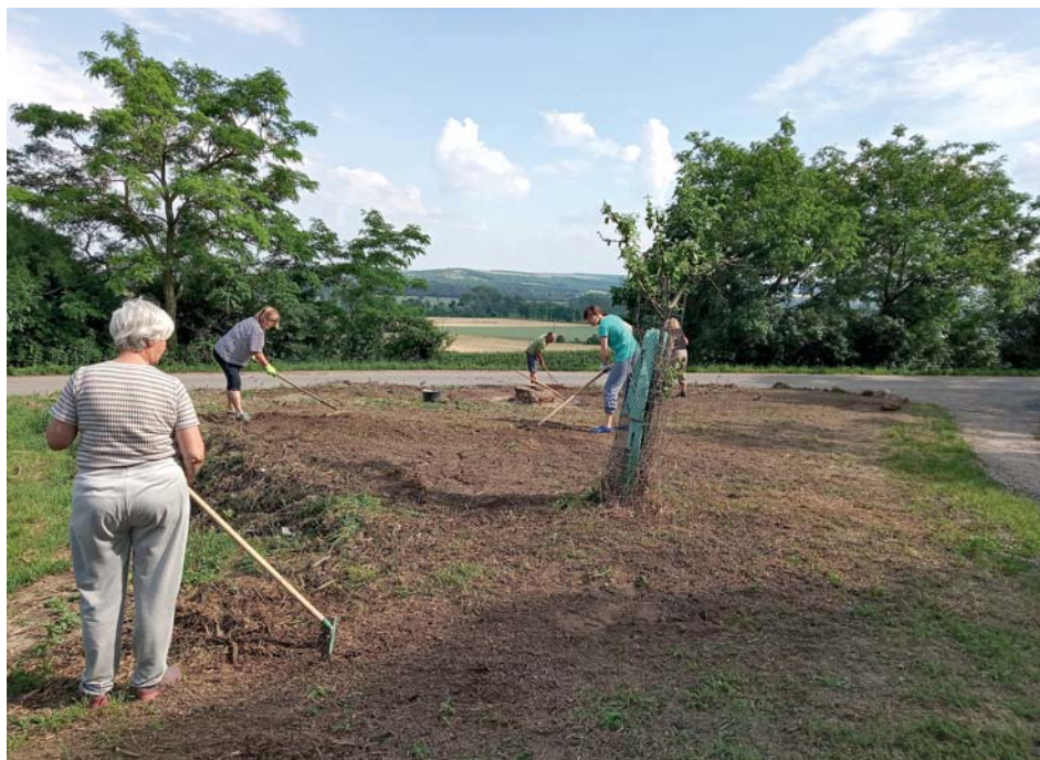
Brigáda členů Muzejního spolku k úpravě terénu a výsevu travní směsi, červen 2020