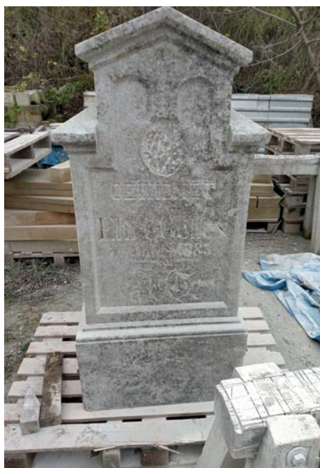
Žulové tělo křížku po prvotním očištění, jaro 2020