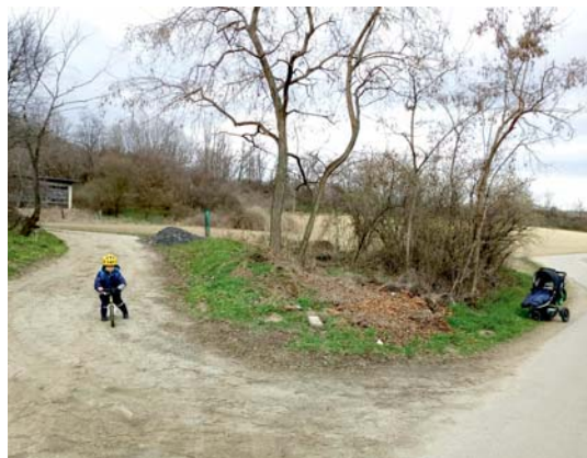
Výchozí stav území s nalezeným povaleným křížkem, duben 2019

Informace týkající se křížku Muzejnímu spolku poskytl Mgr. Petr Czajkowski, památkář z Oddělení evidence památek z Národního památkového ústavu, územního odborného pracoviště v Brně: Jedná se o kamenný blok, zřejmě podstavec kříže – vzhledem k dataci pravděpodobně litinového. Na pořízeném a poskytnutém snímku není bohužel vidět horní vrchol bloku, do něhož byl kříž osazen. Další možností je, že tento kamenný blok stál před zděným základem tohoto kříže (v tom případě by na reverzu či bocích bloku