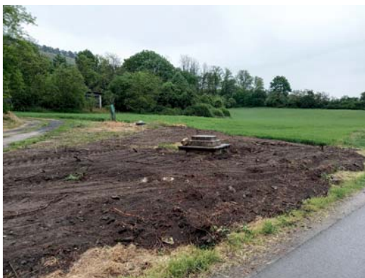
Hrubá terénní úprava místa, podzim 2019