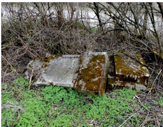
Nálezová situace, duben 2019