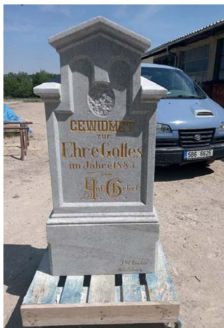
Žulové tělo křížku po restaurování a vyzlacení písma textu, léto 2020