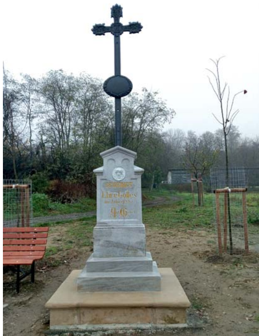
Památka po celkovém sestavení i s litinovým křížem, podzim 2020