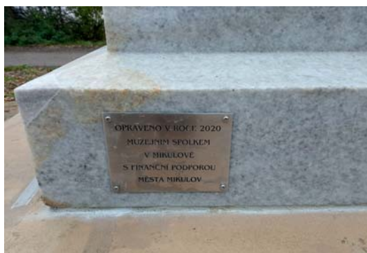
Informační tabulka na patě těla křížku, podzim 2020