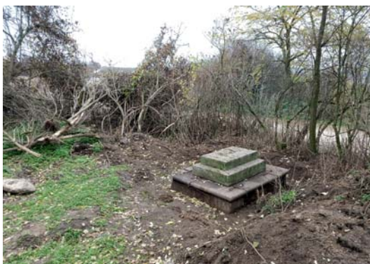
Obnažený původní sokl pod křížkem, podzim 2019