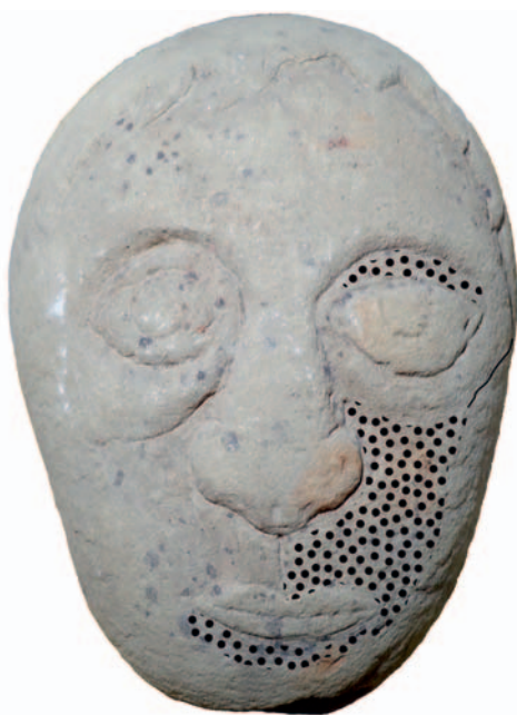
Obr. 3: Zobrazení oblasti ve tváři plastiky s výraznými stopami po opracování kamene (tečkované)