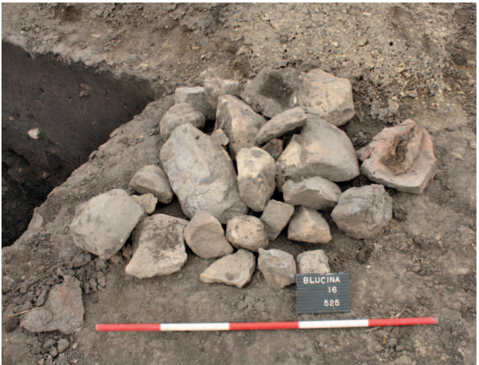
Obr. 4: Blučina - Pastviska. Nálezy přírodních balvanů v zahloubených silech z doby bronzové

Z přehledu archeologických lokalit a zastoupených komponent je zřejmé, že výrazněji převažuje mladší zemědělský pravěk a protohistorická období. Nálezy z těchto lokalit ovšem představují standardní inventáře, které nejsou žádným vodítkem, jež by mohlo být prospěšné pro vysvětlení původu kamenné hlavy. Jedinou výjimkou jsou nálezy archeologického výzkumu na polykulturním sídlišti v okolí dálničního nájezdu u Blučiny, kde byl zjištěn výskyt podobných kamenných balvanů ve výplních a na dnech archeologických objektů. Je tedy možné, že z této oblasti mohl pocházet i balvan, který posloužil k vytesání kamenné hlavy. Stylisticky ovšem není kamenná hlava přiřaditelná k žádným archeologickým komponentám v okolí.