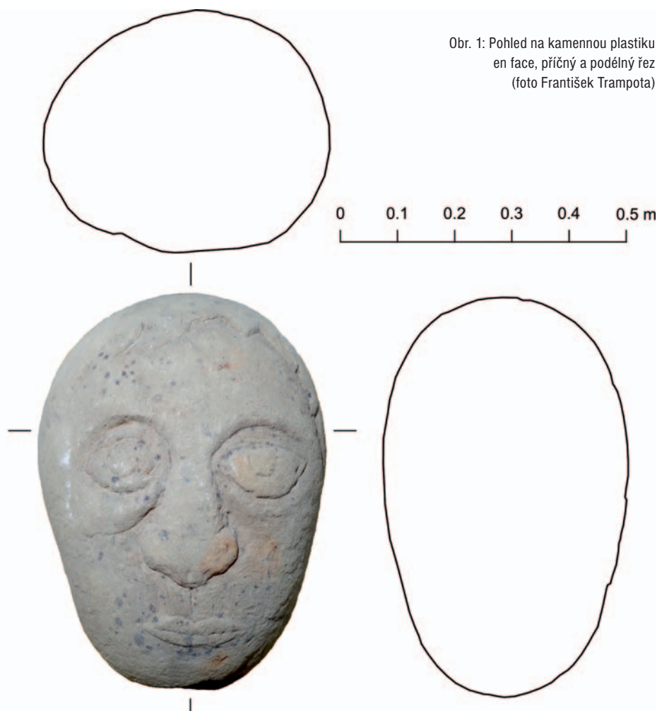
Obr. 1: Pohled na kamennou plastiku en face, příčný a podélný řez

V roce 1975 bylo vydáno stavební povolení na stavbu úseku dálnice D2 Blučina–Hustopeče. V rámci archeologické památkové péče však této stavbě žádná významná pozornost věnována nebyla, v důsledku čehož je v tomto úseku dálnice dle Státního archeologického seznamu známa pouze jediná archeologická lokalita, identifikovaná již v 19. století. Způsob nakládání s archeologickými nálezy v sedmdesátých letech 20. století ilustruje i náhodný nález, o kterém článek pojednává.