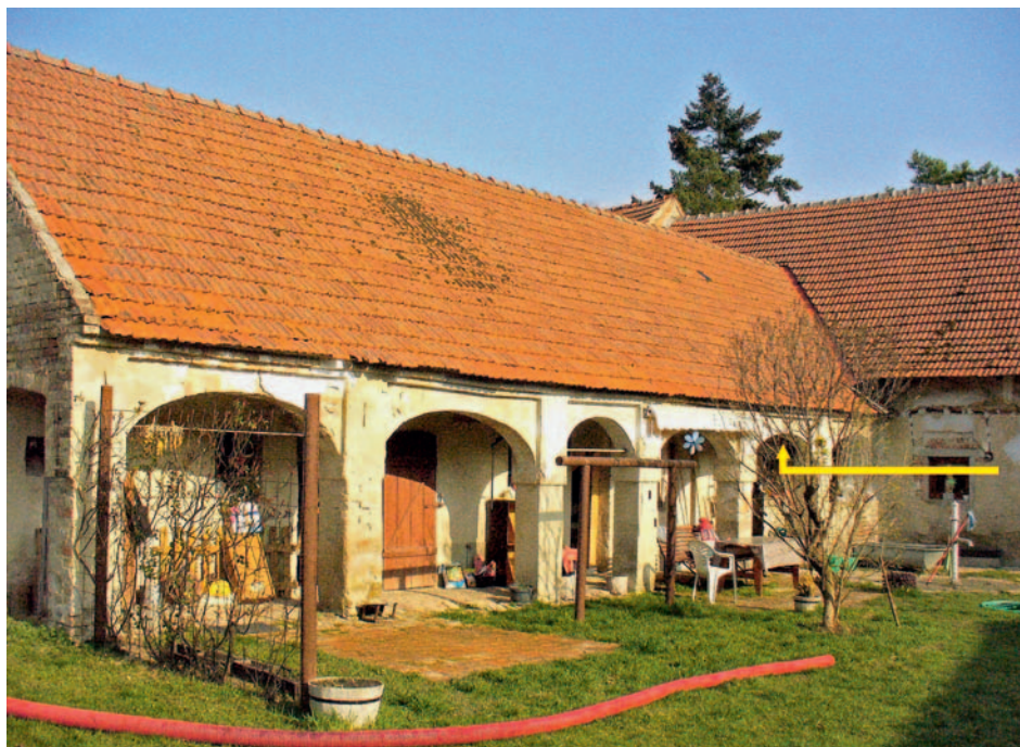
Arkádové zápraží domu čp. 81 ve Strachotíně s vyznačeným místem (žlutá šipka), kde se nachází signovaný trám – stav objektu v roce 2016.

V níže uvedeném příspěvku bude za pomoci archivních pramenů objasněn signovaný monogram na trámu, zdůvodněno využití trámu v další konstrukci a ozřejmeno bude i jeho původní místo výskytu.