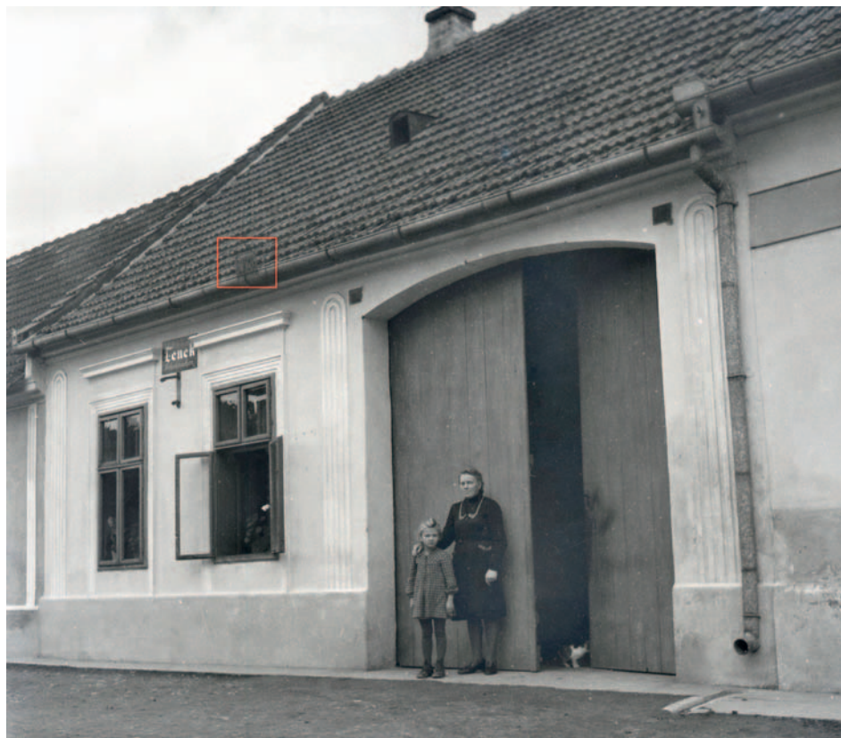
Dům čp. 17 ve čtyřicátých letech 20. století; červený rámeček upozorňuje na plaketu s vytepávaným vročením 1928. (foto z roku 1944 – Fotoarchiv EÚ HM MZM, inv. č. FA 18278)