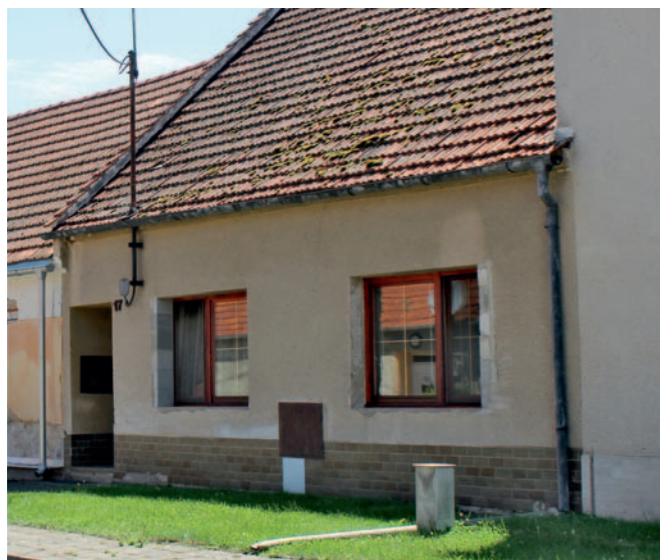
Dům čp. 17 v současné době (2020), po přestavbě v sedmdesátých a osmdesátých letech 20. století