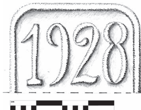
Kresbná rekonstrukce plakety z domu čp. 17 (kresba Jana Křivánková)

čp. 17, dokázal je zužitkovat při opravách domu čp. 81 bratra Sylvestra.