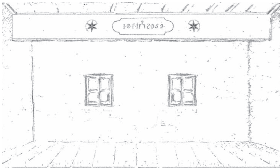
Kresebná rekonstrukce možné podoby trámu při užití ve světnici v druhé polovině 19. století (kresba Jana Křiváňková)

Plaketa se nachází ve středu okapu směrem do ulice, na fotografii je také vidět vývěsní štít s nápisem Tenek Schuhmacher (švec). 27