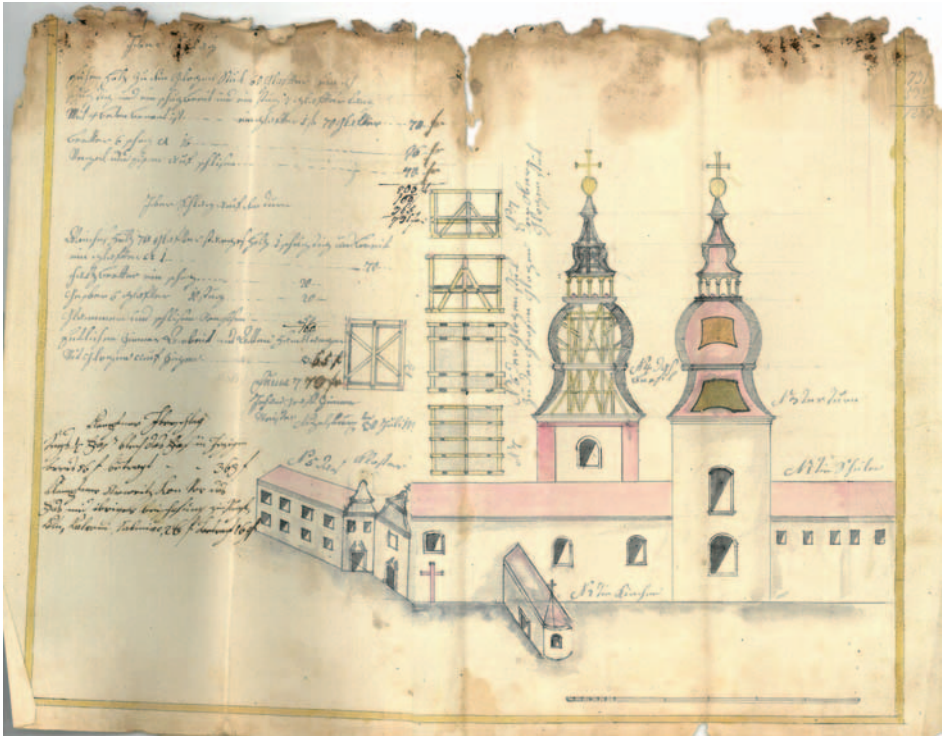
Plán věže z roku 1799 s uvedeným rozpočtem stavby

ve Valence a následně volbu jeho nástupce Pia VII. počátkem následujícího roku. A pak už záznam vyjmenovává všechny, kdo něco znamenali – zmiňuje císaře Františka II., knížete Jana Karla z Dietrichsteina a jeho čtyři syny, probošta mikulovské kapituly, faráře nově zřízené farnosti u sv. Jana Křtitele, uvádí všech 27 mikulovských piaristů, městskou radu i kostelníky. Soudobou situaci v zemi a ve světě hodnotí pisatel jako velmi zlou – už řadu let Evropa trpí válkami s Napoleonovou Francií, vraždění a loupení, jaké se děje, dostoupilo do takové míry, jak to nikdo nepamatuje. Rok je sice s výjimkou vinné révy dosti úrodný, přesto panuje velká drahota a ceny všeho zboží vystoupily do nebývalých hodnot. Kovové peníze už skoro není nikde vidět, všude je nahradily bankocetle. A po tomto neveselém politicko-ekonomickém komentáři přechází autor plynule k problému, který ho osobně zřejmě hodně trápí: Ani věda na tom není lépe. V gramatických třídách se stejně jako z velké části ve třídách humanitních učí filozofie i morální a pastorální teologie německy, od latiny se už skoro upustilo. Kéž dá Bůh nám i naším nástupcům lepší časy! Samotný závěr pamětního zápisu patří jmenům řemeslníků, kteří měli na stavbě věže největší zásluhy.