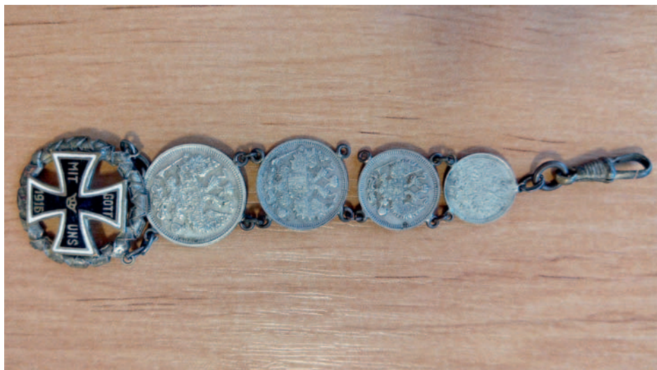
Vojenský kříž s řetízem z mincí

1916 – 1 koruna 1919 – 100 korun – státoška 1922 – 10 korun – Rakousko 1953 – 1 koruna – státoška 1953 – 3 koruny – státoška