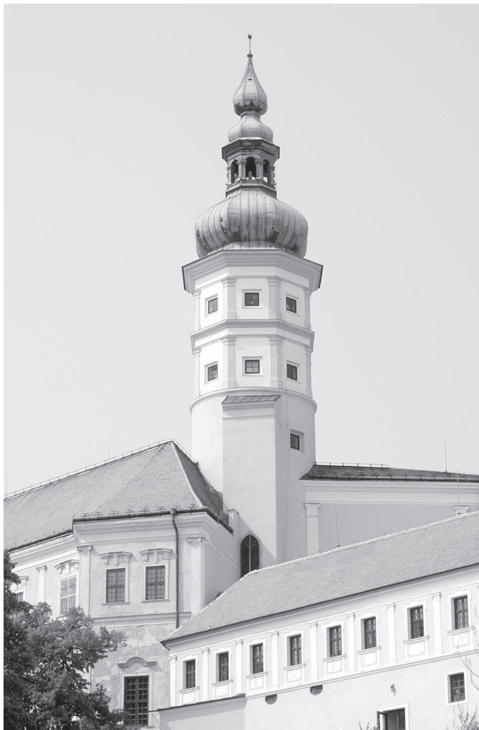
Gotická kaple byla vybudována v patře válcové věže stojící u skalní brány