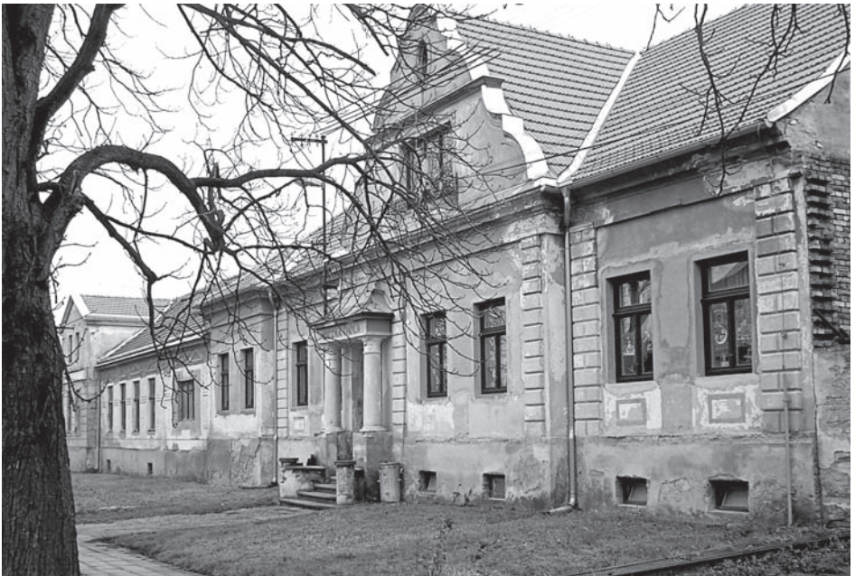
Dnešní pohled na budovu někdejší české menšinové školy v Prátslsbrunu