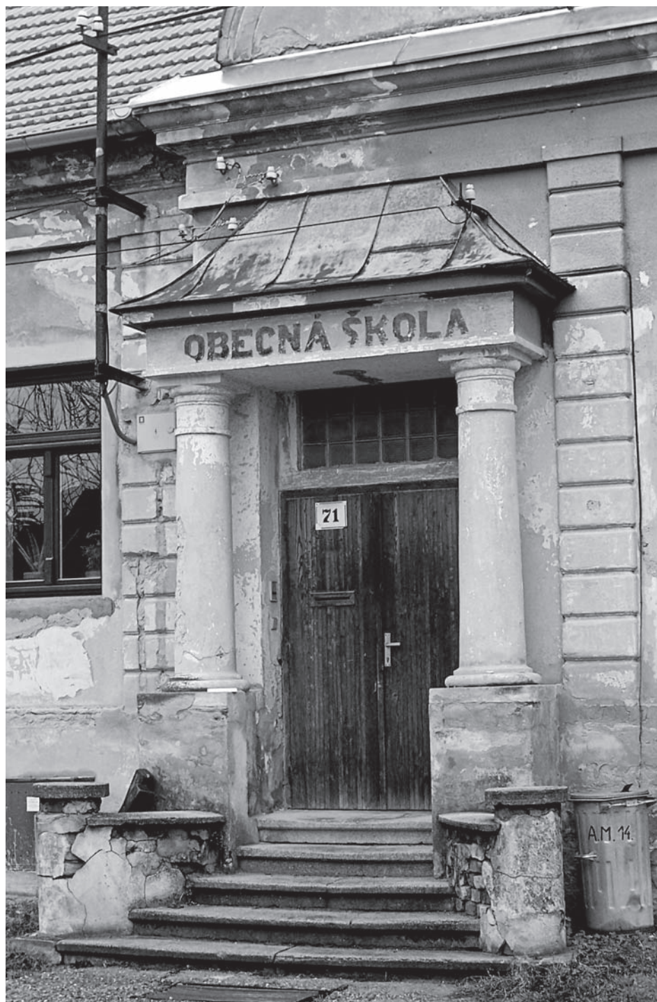
Vstup do někdejší české menšinové školy v Prátsbrunu