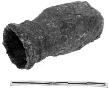
Klentnice, Stolová hora. Bronzové kladívko.

Bohužel, obrazně řečeno, toto jsou pouze drobky, které hledačům pokladů odpadly od úst. Valná většina jistě stejně zajímavých, nebo dokonce zajímavějších nálezů nenávratně zmizela. I když by se to tak mohlo jevit, není rozkrádání archeologických památek pouze fenoménem dnešní doby. Objevilo se současně s objevením jejich kulturní hodnoty a v návaznosti na to i vyjádřením jejich hodnoty finanční. Dnes je „pouze“ podtrženo dostupností nových technologií a paradoxně také snahou archeologů předávat své poznatky co nejširší veřejnosti. Žel nezbývá než si klást řečnickou otázku, kolik z našich kulturních památek a duchovních tradic zůstane zachováno pro budoucí generace zájemců o jejich poznání.