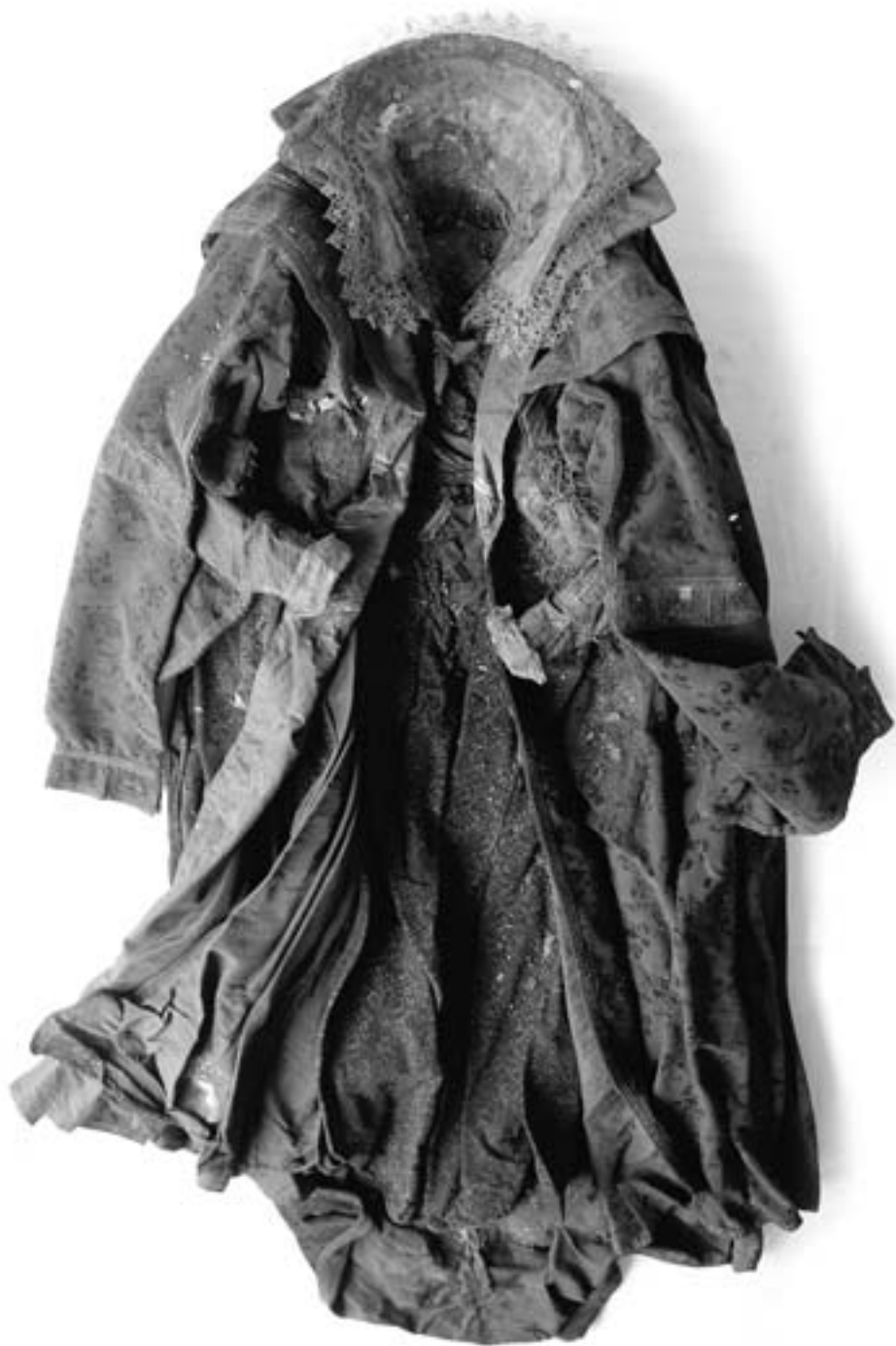
Pohřební roucho Markéty Františky před konzervováním.