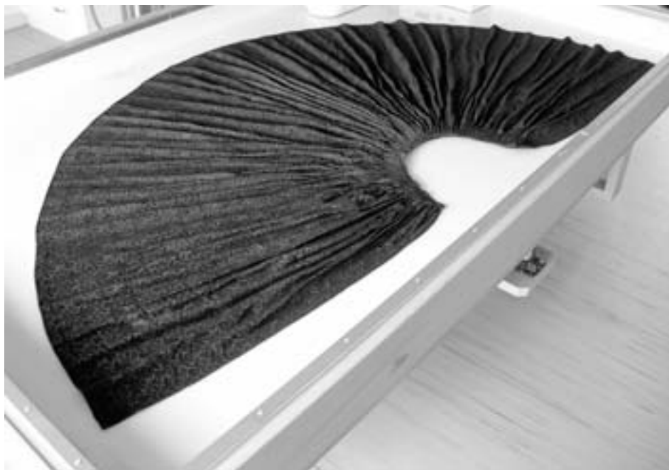
Vyčištěná sukně pomalu schne.