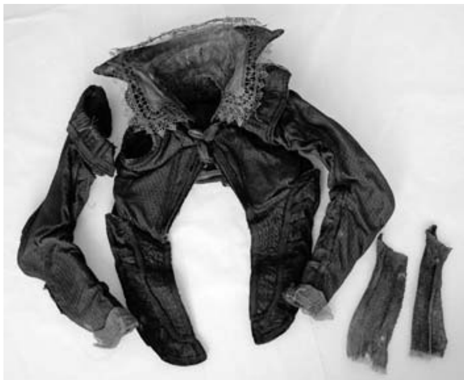
Živůtek po odsátí sypkých nečistot.

Rovněž tkanina živůtku byla před konzervováním pomačkaná, ztvrdlá, ale soudržná a jen výjimečně proděravělá nebo prasklá.