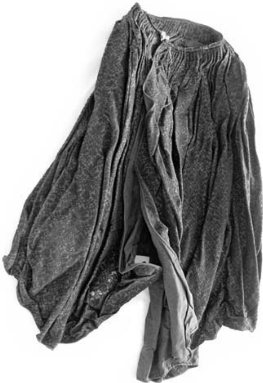
Sukně před konzervováním.

Přední část figuríny s pláštěm jsem potáhla tmavohnědou hedvábnou tkaninou, která má naznačit živůtek a sukni. Z téže látky byly ušity měkce vycpané napodobeniny úzkých rukávků živůtku. Přišila jsem je k ramenům figuríny a protáhla rozparky v rukávech pláště, aby i při odděleném vystavení zůstal způsob nošení takového oděvu jasný. Tvar sukně u obou stojanů je kuželovitý, podpořený jednoduchou konstrukcí s obručemi.