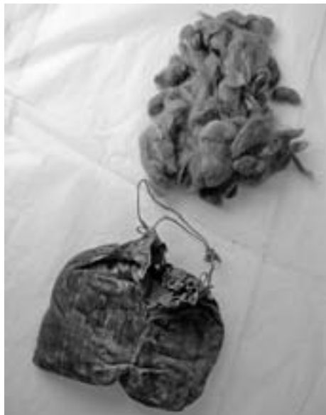
Sametový váček obsahující smotky vlasů.

Oděv Markéty Františky Lobkowiczové je v celoevropském měřítku jedinečnou textilní památkou. Šťastnou shodou okolností se do našich dnů dochoval v podivuhodně dobrém stavu a díky péči Regionálního muzea v Mikulově mohl být restaurován a veřejnosti představen v tamní expozici.