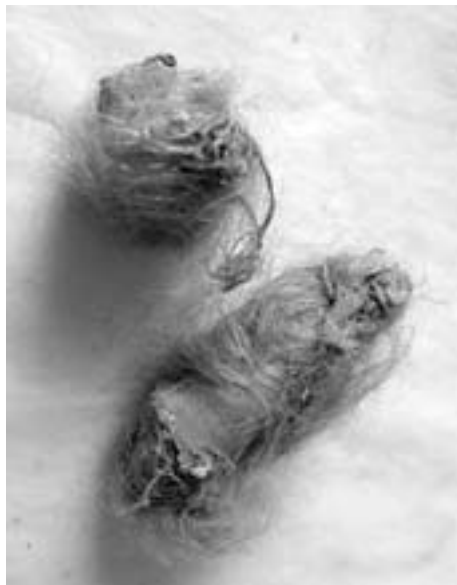
Dva malé balíčky z hedvábného plátka mezi smotky v sametovém váčku.