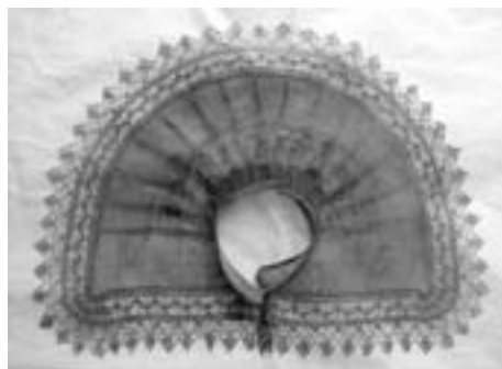
Límc po vyčištění a vyrovnání.