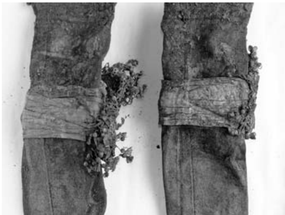
Punčochy a podvazky před konzervováním – detail.