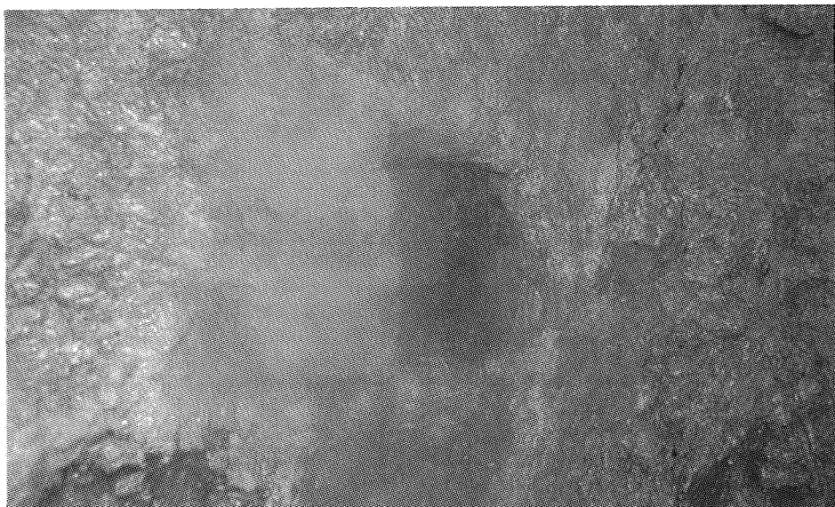
Cihlová vyzdívka pro uchycení trámu ve studni.

nebyli úspěšní, našli jsme pouze recentní materiál, v němž převažovaly fragmenty cihel, střešních tašek, úlomky skla apod.