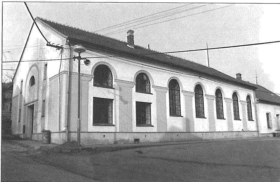
Budova kloboucké sokolovny v roce 1998