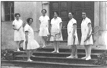
Akademie – vystoupení žen v roce 1927

Rekordní počet členů klobouckého Sokola byl evidován koncem roku 1947. Bylo to 327 registrovaných členů, s žactvem, které však nebylo registrováno, to bylo 500 členů. Tento historický počet kloboucké sokolské členské základny nebyl nikdy překonán. Můžeme hovořit o její zlaté éře. Z funkcí, které k tělovýchovné jednotě patřily, jmenujme: starosta, I. náměstek, II. náměstek, náčelník, místonáčelník, náčelnice, místonáčelnice, vzdělavatel, pokladník, matrikář, kronikář a archivář, knihovnik, stravovací referent, ubytovatel, praporečnick, rozhlasový referent. Z odborů: stavební, dramatický, pořadatelský, propagační, tiskový, sociální a vzdělavatelský. Z uvedeného vyplývá, jak široké spektrum činnosti jednota v té době vyvíjela. Žel, tento stav netrval dlouho. V říjnu 1948 akční výbor Národní fronty v Kloboukách některé členy zbavil jejich funkcí a vyloučil z jednoty. V roce 1949 bylo rozhodnutím Okresního soudu v Hustopečích