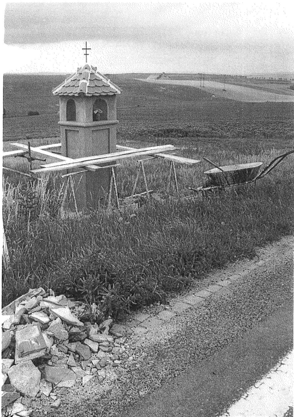
Obr. 2 - oprava boží muky v Kloboukách u Brna