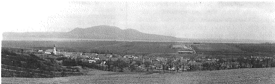
Obr. 1 - Popice

Severní část katastru se značně členitým terénem byla částečně zterasována. vytvořila se zde hodnotná mozaika stepních společenstev a menších ploch polí, sadů a vinic. V této části katastru také chovají myslivci lovnou zvěř.