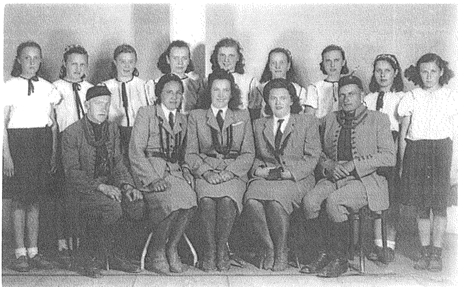
Obr. 1 – členové sokola, rok 1948