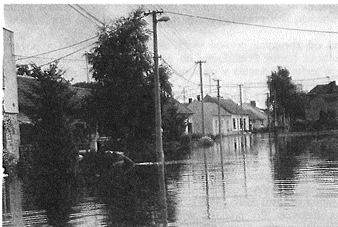
Obr. 1 – Zaplavený Týnec v červenci 1997

Výjimečné srážky způsobily katastrofální záplavy na severní Moravě, které se postupně rozšířily i na jižní Moravu a zasáhly i naši obec, která díky své poloze v bezprostřední blízkosti říčky Kyjovky patřila k nejpostiženějším obcím okresu Břeclav (obr. 1).