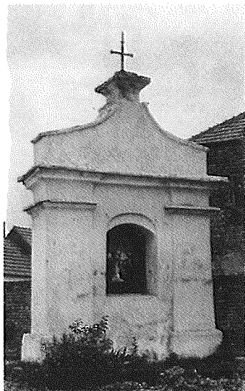
Kobylí – poklona sv. Mikuláše

Roku 1987 byla poklona přemístěna o několik metrů dál na parcelu 5428 a vlastně vybudována znovu jako věrná replika původní stavbičky. Důvodem přemístění byla výstavba rodinných domků. Spotřeba materiálu: 3 700 kusů plných cihel, 4 m 3 šterkopísku, 4 m 3 písku, 12 q cementu, 5 q mletého vápna, IPA 4 m 2 , 230 kusů střešních tašek, 15 kusů hladkých hřebenačů. Rozměry 1,10 x 3,4 m a vysoká cca 6,5 m.