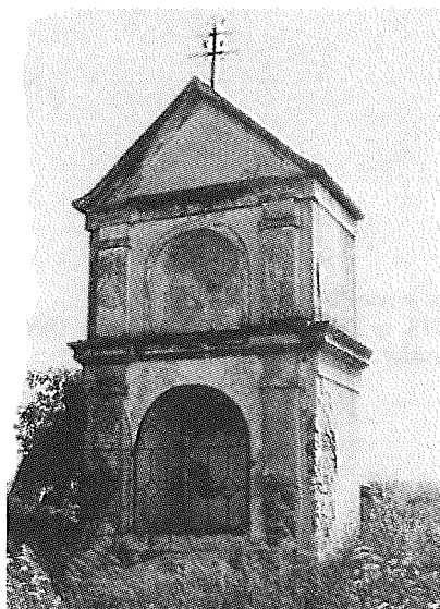
Popice – poklona P. Marie (stav před opravou)

Poklona P. Marie stojí u polní cesty do Hustopečí. Stavba obdélného půdorysu je horizontálně členěna vyloženou profilovanou kordonovou římsou, která přechází na obě boční fasády. Spodní část průčelí je prolomena širokou půlkruhově zaklenutou nikou uzavřenou dvoukřídlou kovanou mříží, chráněnou ještě jednokřídlými dvířky z drátěného pletiva. V nice obraz P. Marie. Po stranách niky pilastry s římsovou hlavicí a na ní úseky