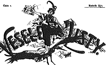
Humoristicko-satirický čtrnáctidenník. V Hustopečích, dne 5. října 1892.