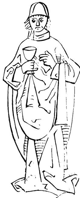
Obr. 4 - Nejstarší deska z počátku 15. století