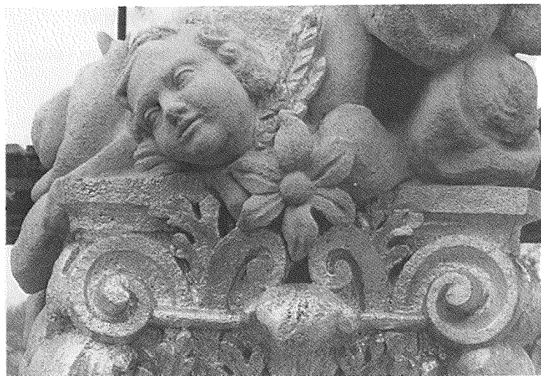
Drnholec, Sloup Panny Marie na náměstí, 1995 restauroval: ak. soch. Jarmil Plachý, Miloš Gavenda, Praha