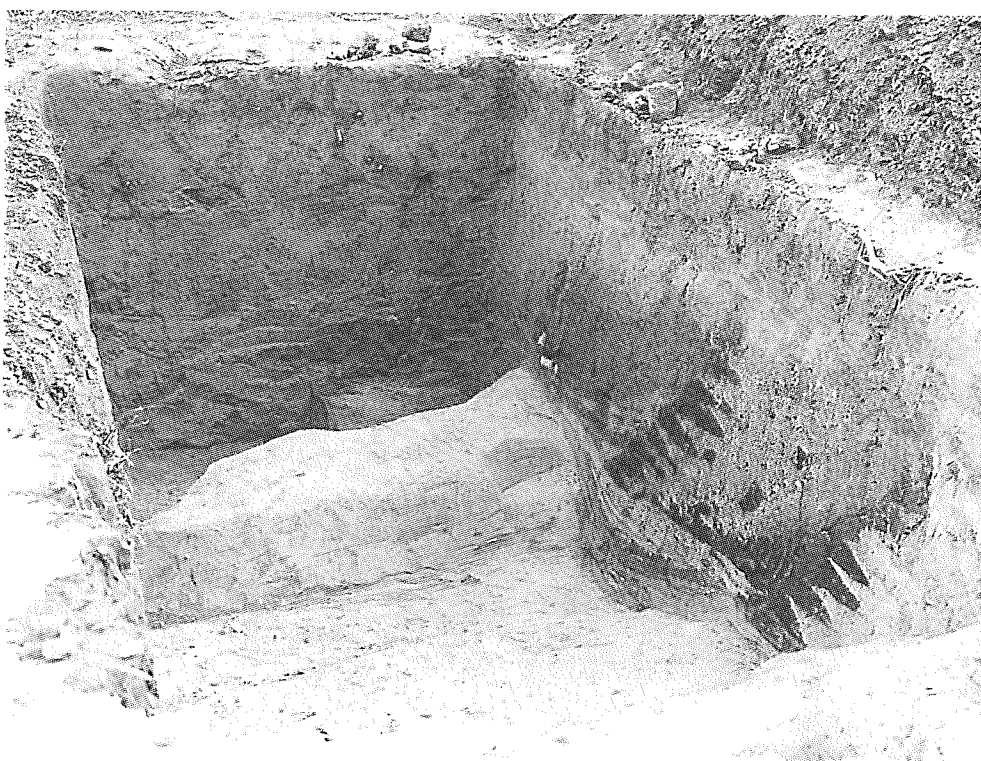
Obr. 3. Hustopeče. Řez zdvojeným drnovým zpevněním svahu motte.

Počátky budování opevněných sídel typu motte na jižní Moravě můžeme klást do doby kolem poloviny 13. stol. Svědčí pro to nejen výsledky systematického výzkumu na zaniklém Koválově, ale i výzkum v zaniklých Divicích a v Hustopečích. Podle současného stavu našeho poznání se zdá, že počátky souvisejí s napjatou situací, která vznikla kolem odboje královice Přemysla proti králi Václavovi I. v letech 1248 až 1249 (Žemlička 1985).