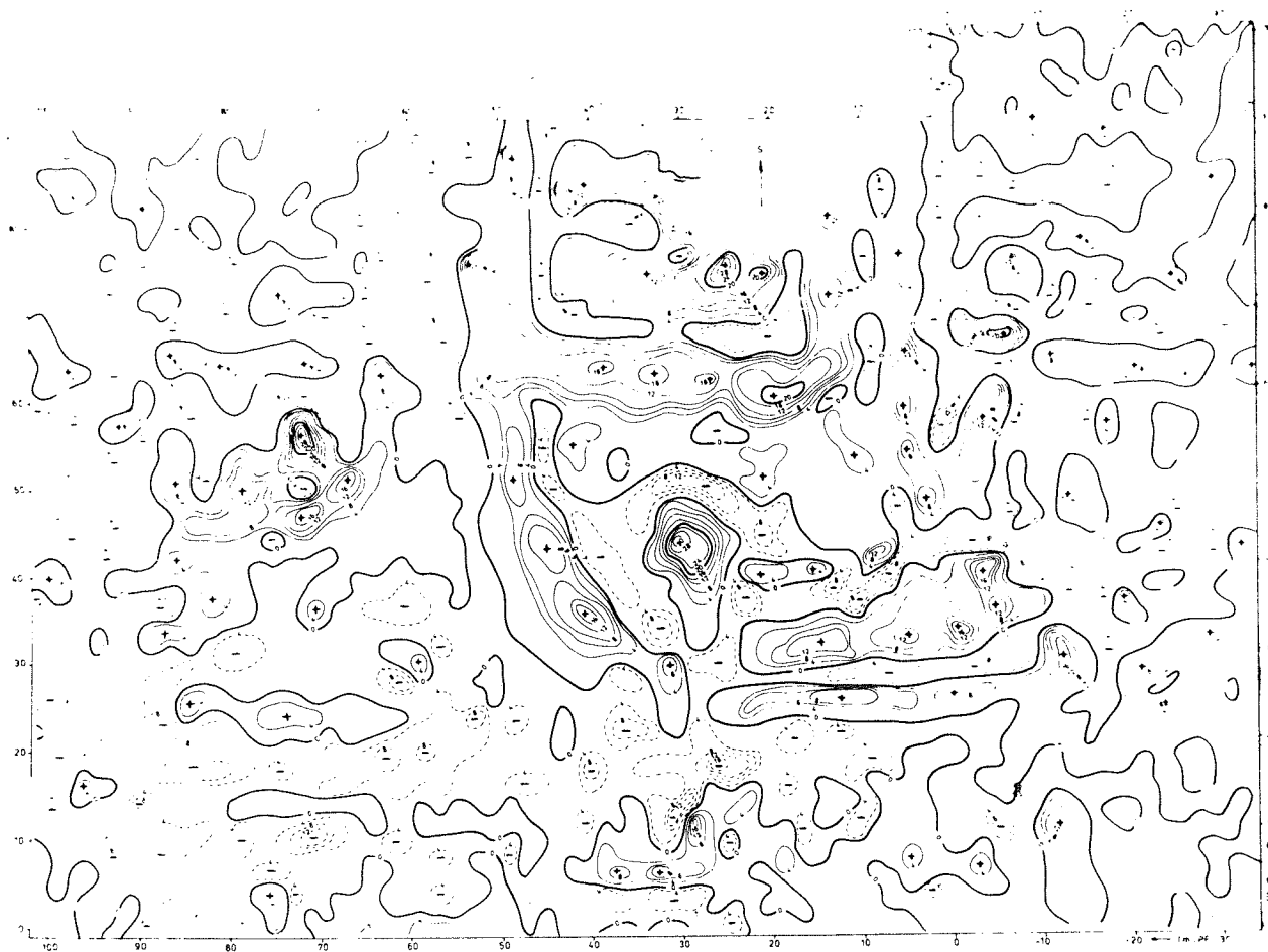
Obr. 4. Divice. Geofyzikální měření v areálu sídla.