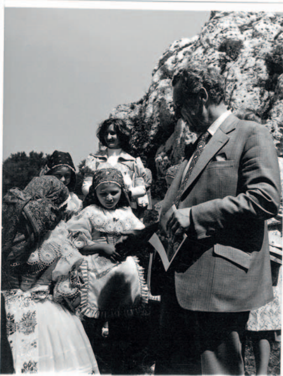
Kopie listu v Pamětní knize (Kronice) CHKO Pálava, uložené na Správě CHKO, se zápisem ministra kultury Milana Klusáka, provedeným na slavnostním vyhlášení CHKO u Siroťího hradu 28. 5. 1976