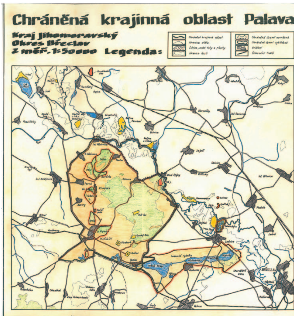
Mapa z roku 1976 s vymezením návrhu hranic CHKO Pálava a přiléhajících hranic dnešní NPR Lednické rybníky

cestě kolem školy (proti železniční zastávce) až ke kótě 306,4 odkud sleduje okraj lesa Kolby až k odbočce polní cesty (na východním okraji lesa Kolby). V těchto místech se stáčí hranice ochranného pásma směrem jižním a pokračuje opět po polní cestě až k jejímu vyústění na silnici mezi Pouzdřany a Popicemi. Dále postupuje po silnici přes obec Popice až k odbočce silnice do Strachotína, kde se napojuje na železniční trať, a ta tvoří hranici ochranného pásma až ke kótě 168,2 na československo-rakouské státní hranici (železniční hraniční přejezd Břeclav–Bernhardstahl). U kóty 168,2 se stáčí směrem západním a pokračuje po československo-rakouské státní hranici až k silničnímu hraničnímu přechodu jižně Mikulova (Mikulov–Drasenhofen) a odtud opět směrem západním po státní hranici až k silničnímu mostu Mikulov–Ottenthal. Od zmíněného mostu vede po silnici až ke křižovatce této silnice s drážním tělesem na jihozápadním okraji Mikulova, kde se napojuje na hranici chráněné krajinné oblasti Pálava a po této postupuje až k Nové hospodě, kde se okruh širšího ochranného pásma chráněné krajinné oblasti Pálava uzavírá.