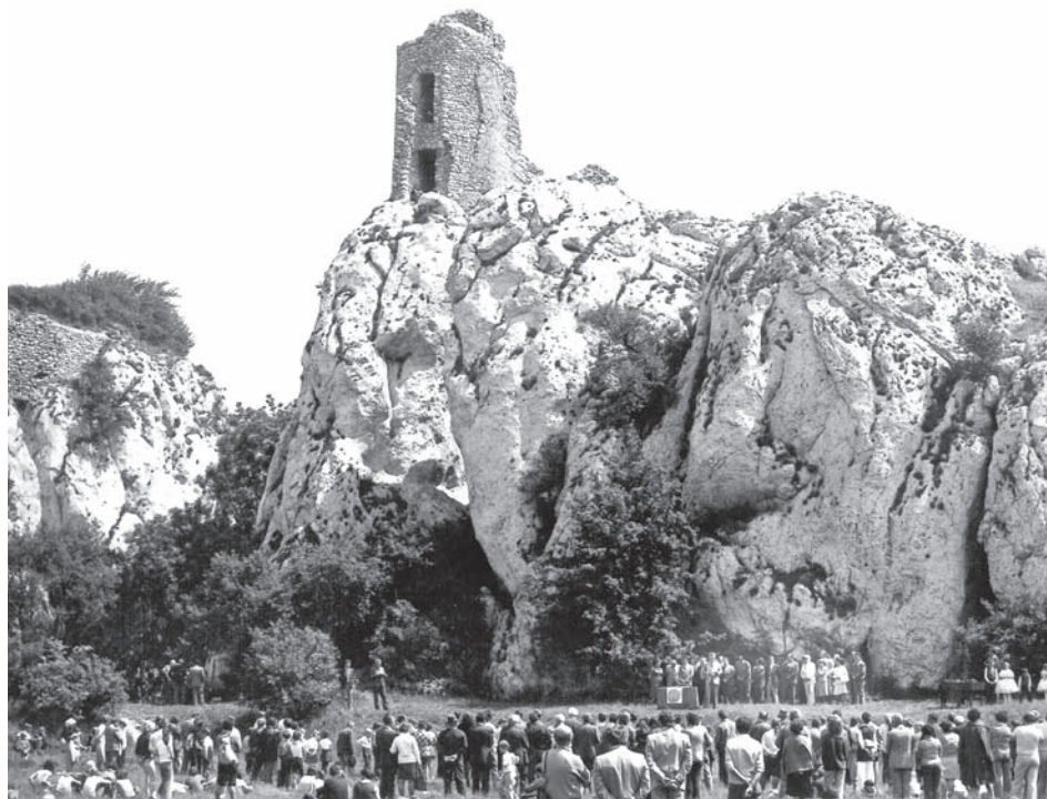
Slavnostní vyhlášení CHKO Pálava, setkání pod Sirotčím hradem u Klentnice