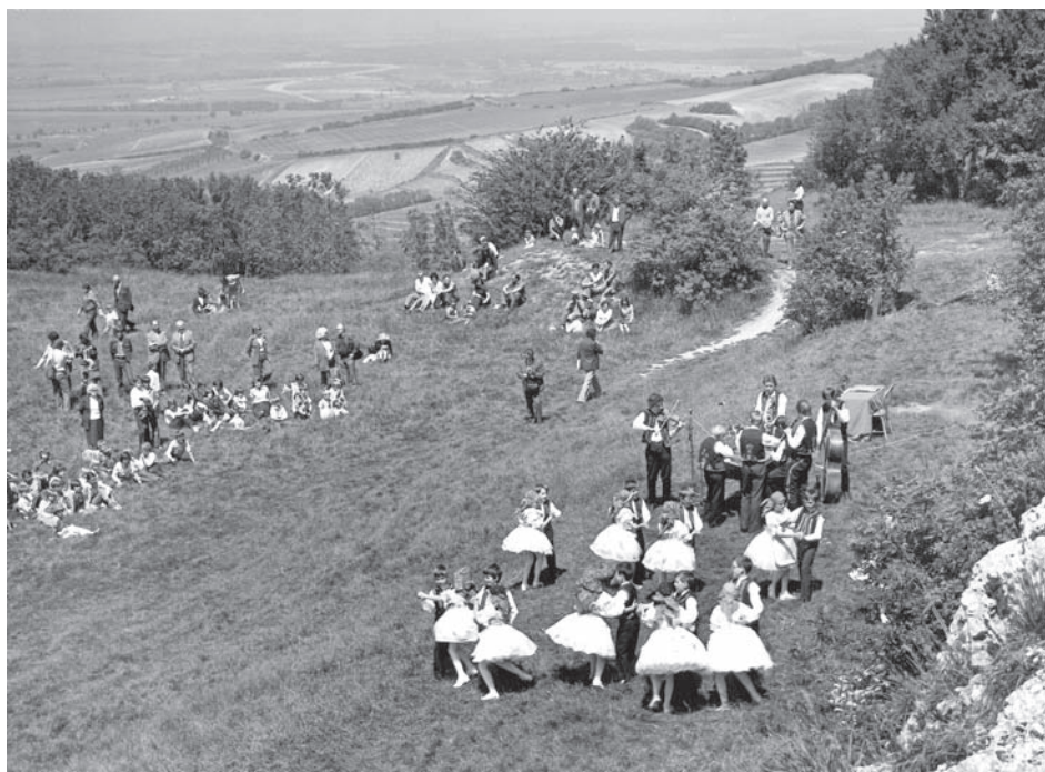
Kulturní program při slavnostním vyhlášení CHKO Pálava – dětský folklorní soubor z Velkých Bílovic