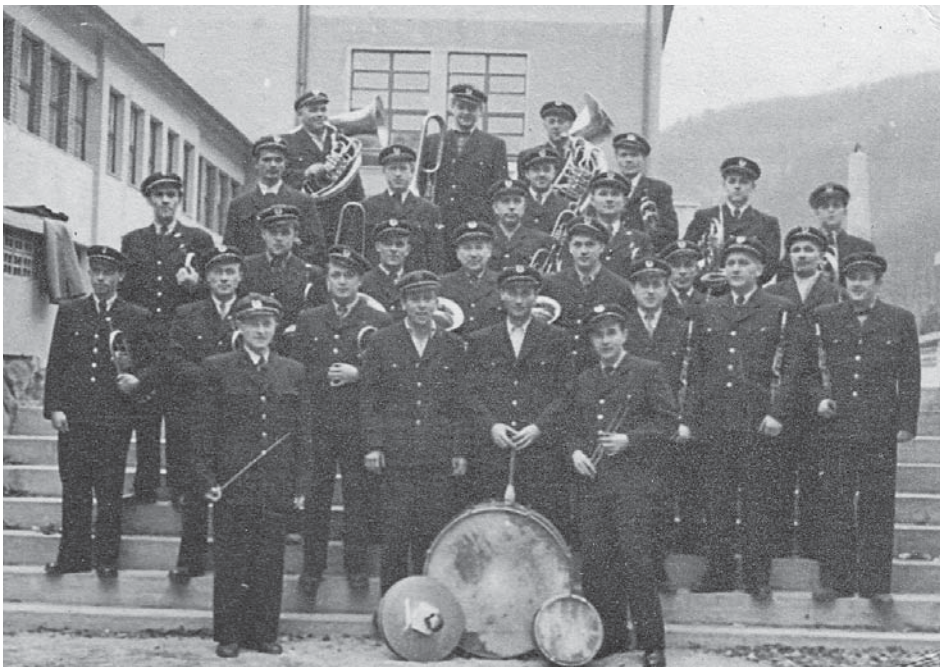
Dechový orchestr Adamovských strojíren

Počátek padesátých let 20. století charakterizuje i závodní časopis Směr a v něm uveřejněná zpráva