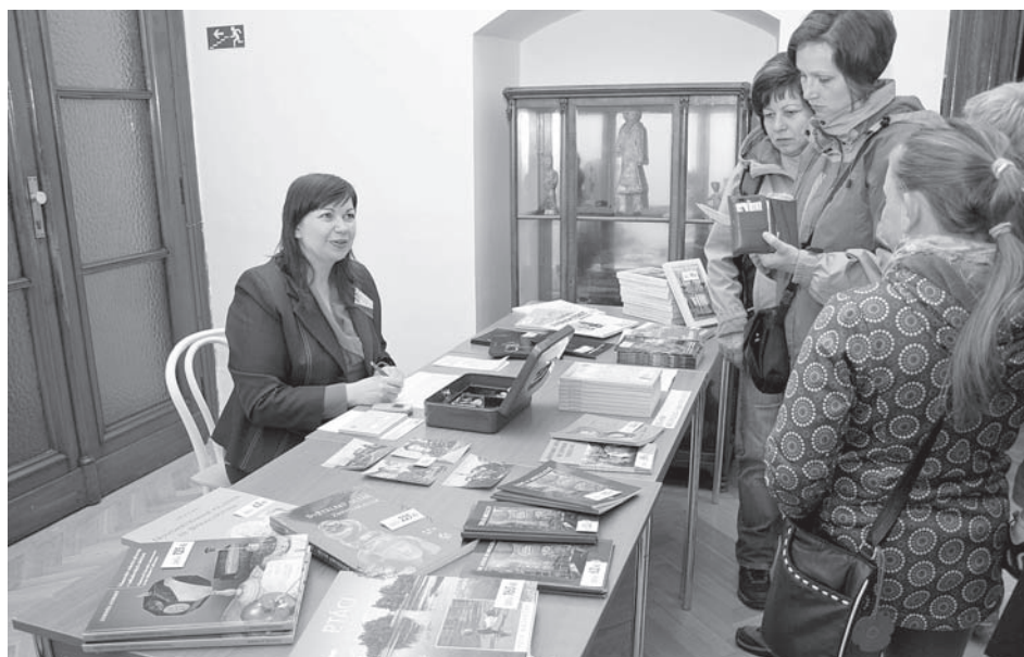
Muzejní publikace o Muzejní noci za přátelskou cenu