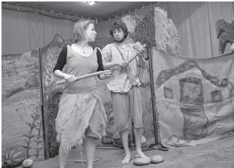
Za diváckými dětmi přijel o Májovém vikendu s olomouckým divadlem Tramtárie pračloviček a povyprávěl jim o nelehkém pravěkému životě

a plánovacím akcím prováděným soukromými osobami, jednotlivými obcemi a firmami. S pozitivním výsledkem byl proveden záchranný archeologický výzkum v lokalitě Mikulov – zámek, horní nádvoří. Při hloubení výkopů pro novou kanalizaci zde bylo odkryto a zdokumentováno torzo středověkého zdiva a část raně středověké kulturní vrstvy. Byla vypracována nálezová zpráva. Výzkum probíhal v červenci 2013.