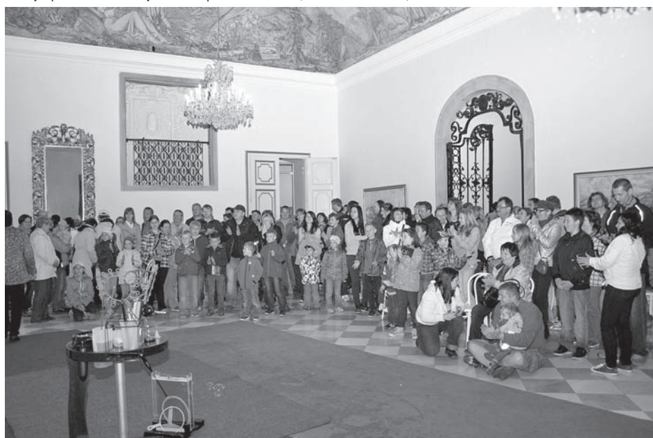
Tajuplný přístroj na výrobu bublin – většina dětí si ho chtěla z Muzejní noci odnést domů (foto Milan Karásek)