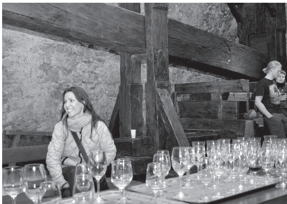
Starobylý kládový lis z poloviny 18. století a veskrze současná číšnice v zámeckém sklepení – blíží se přípitek na závěr Muzejní noci