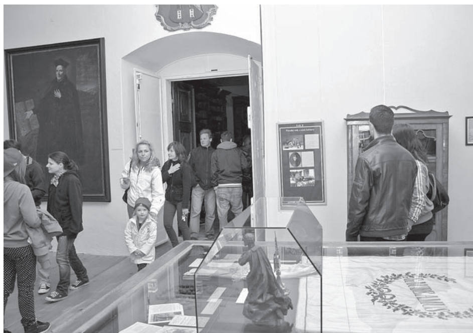
Sv. Josef Kalasanský, zakladatel řádu piaristů, vítá návštěvníky zámecké knihovny, v níž střeží kromě vzácných tisků i výstavu věnovanou zdejšímu piaristickému gymnáziu