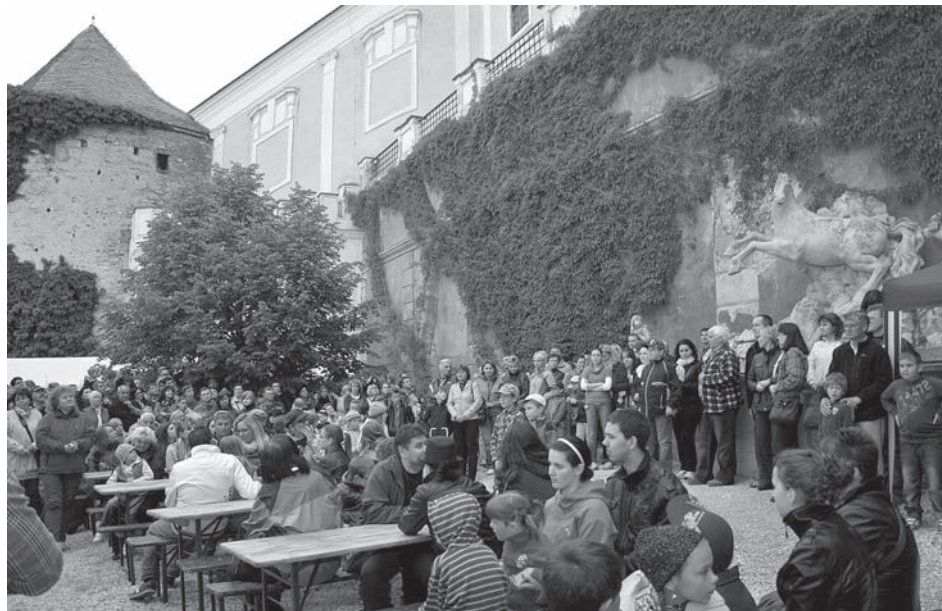
Muzejní noc začíná. Nebude zámek malý?