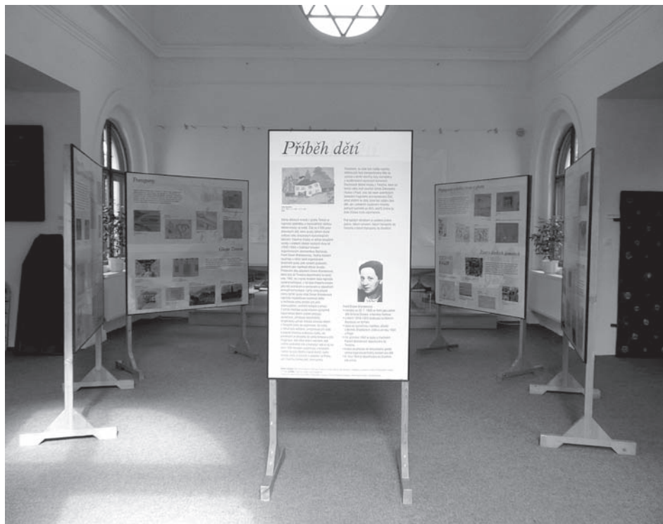
Výstava Příběh dětí instalovaná v obřadní síni židovského hřbitova představila kromě jiného nejrozsáhlejší sbírku dětské kresby na světě – 4 500 prací židovských dětí, které prošly terezínským ghettem

Vrbková, Stanislava: RegioM – 20 let existence, RegioM. Sborník Regionálního muzea v Mikulově , roč. 2012, s. 192–193.