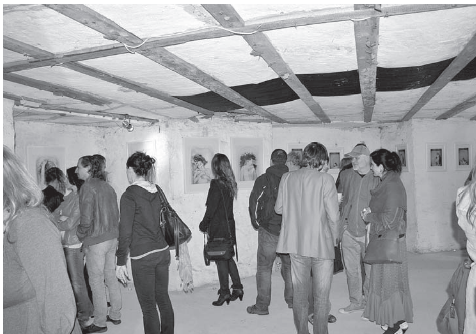
Bez mena – zajímavá výstava, netradiční prostor