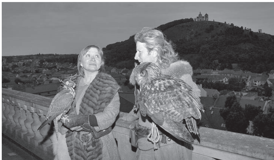
K mikulovské Muzejní noci již dravci patří, stejně jako výhledy na ztemnělé město a Svatý kopeček

že „to opravdu řeže“. Na východní terase měli své stanoviště draví ptáci a ukázka jejich výcviku byla zážitkem pro děti i jejich rodiče.