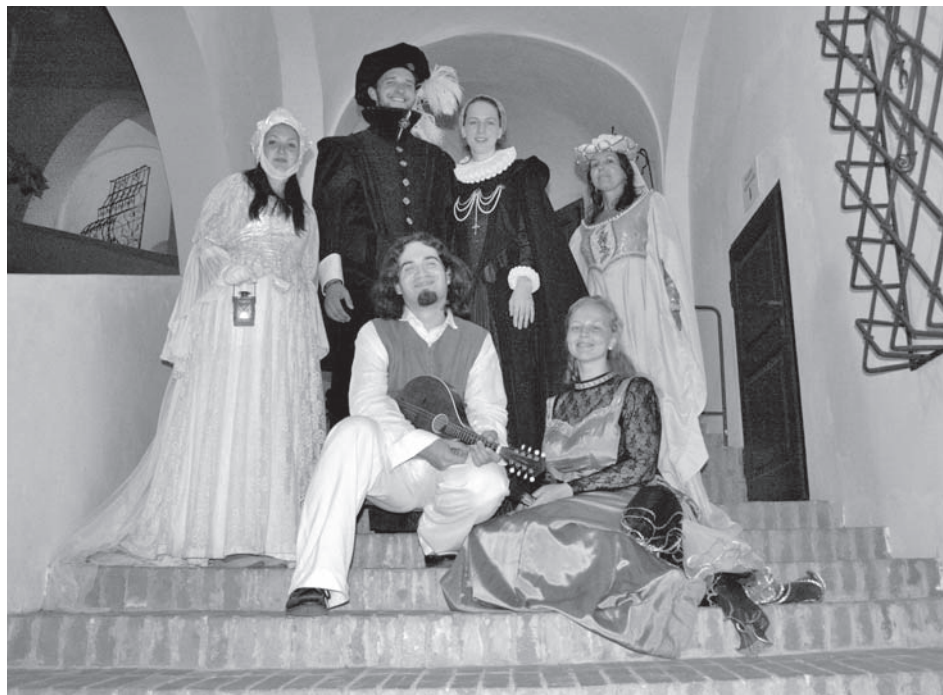
Noční prohlídky si užívali návštěvníci i průvodci. Jen pravá Perchta možná trochu žárčila

Regionální muzeum v Mikulově bylo zastoupeno svou knižní produkcí na knižním veletrhu v Havlíčkově Brodě, konaném ve dnech 18.-19. 10. 2013.