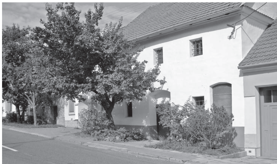
„Bendův sklep“ – vinařská stavba, již kdysi vlastnila rodina Bendova a která dnes aspiruje na zařazení mezi památkově chráněné stavby