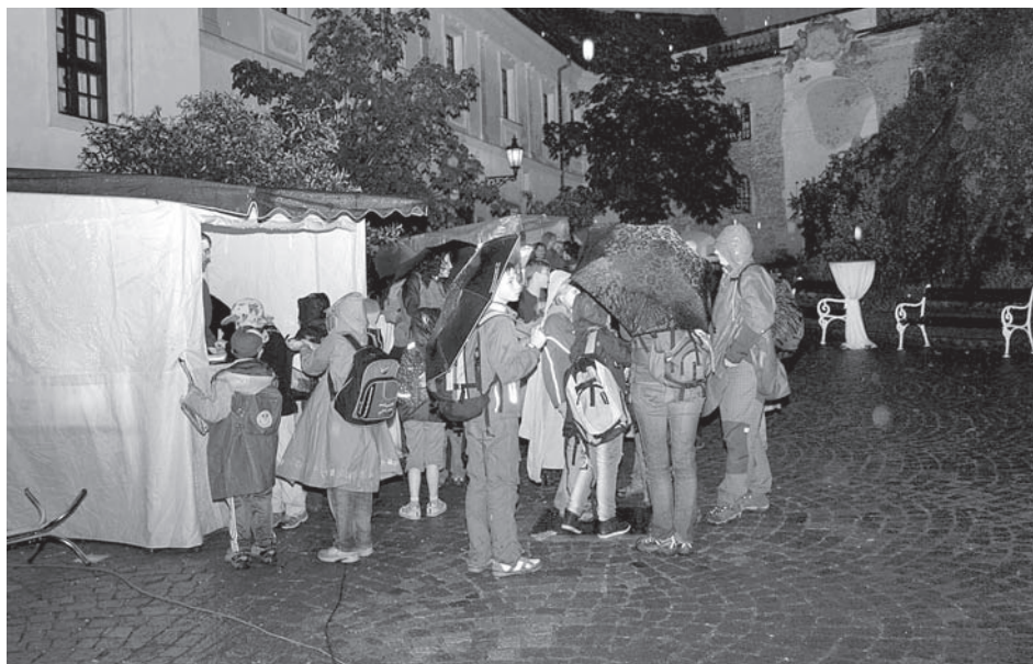
Osobní statečnost hostů bouřlivé, deštivé a větrné muzejní noci byla odměněna zajímavým programem i potřebným teplým občerstvením