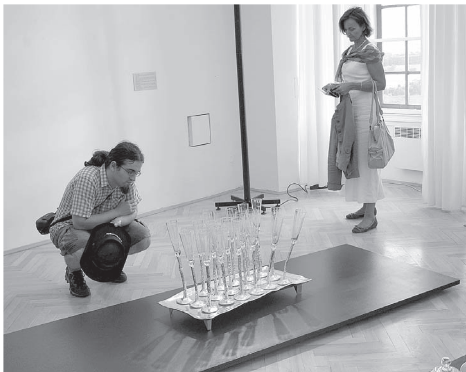
Křehký Mikulov – designové předměty, prototypy, unikáty, autorské originály, ...