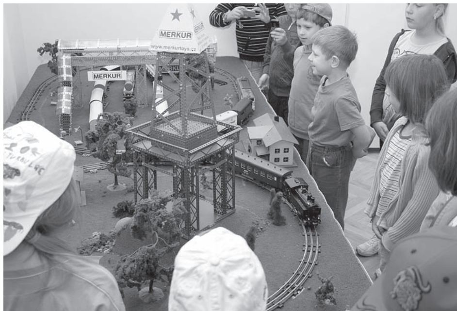
Na dvacet majitelů vláček zapůjčilo své poklady pro jednu z nejnávštěvovanějších výstav sezony s výstižným názvem „Vláčky pro malé i velké“