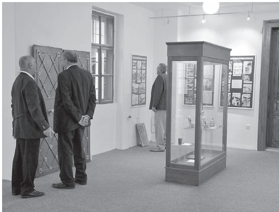
Výstava instalovaná v obřadní síni mikulovského židovského hřbitova byla připomínkou 190. výročí narození Hieronyma Lorma, mikulovského rodáka, tvůrce dotykové abecedy pro hluchoslepy