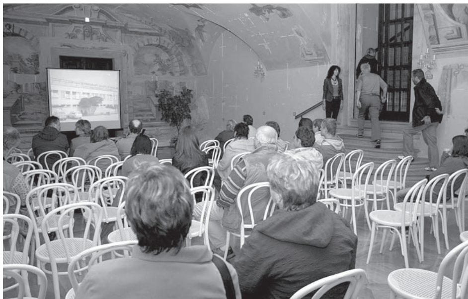
Sala terrena se o muzejní noci proměnila v kino a nabídla promáčeným návštěvníkům krátké dokumentární filmy ze zdejšího regionu, vybrané z muzejního archivu