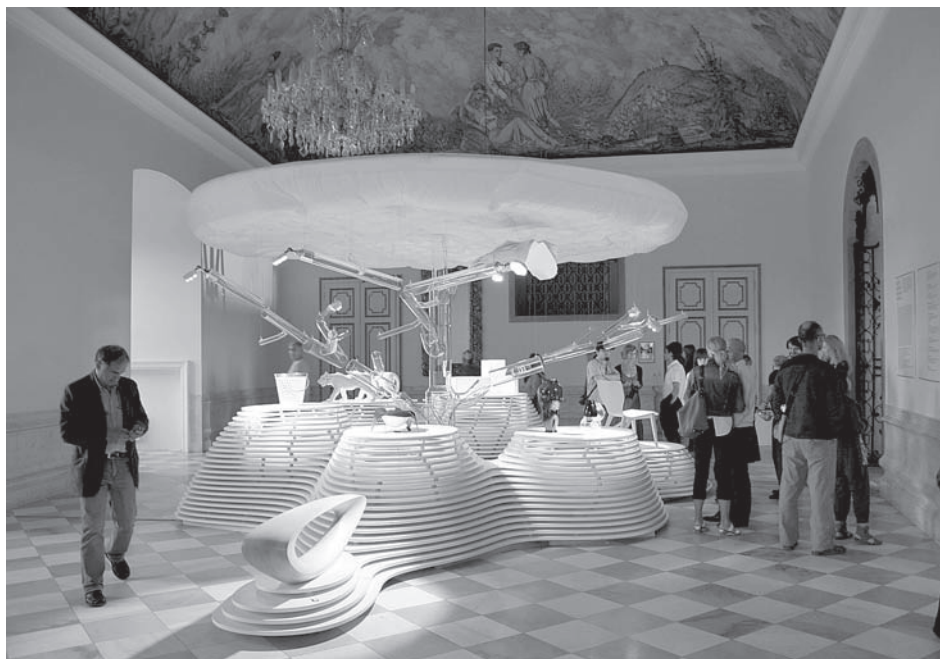
EXPO 2010 Shanghai tentokrát v Mikulově – Archiv zázraků, výstava, která reprezentovala český design na této světové výstavě, se po svém návratu představila českému publiku právě na mikulovském zámku