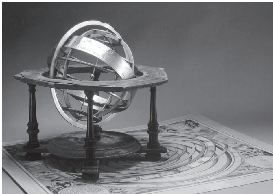
„Piaristické školy v Mikulově a jejich vědecké přístroje“ byla stěžejní výstava roku. Představila historii ústavu sahající až k roku 1631 a jedinečné přístroje z matematického kabinetu gymnázia, udivující svou dokonalostí a krásou