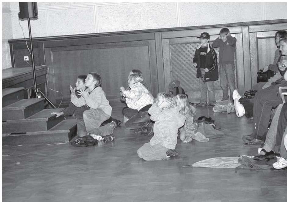
... tomuto poraženému dětské publikum vyprosilo milost

přístroje matematicko-fyzikálního kabinetu uchovány a díky muzeu lze tuto sbírku, jedinečnou způsobem vzniku, v ucelené podobě obdivovat až do dnešních dnů.