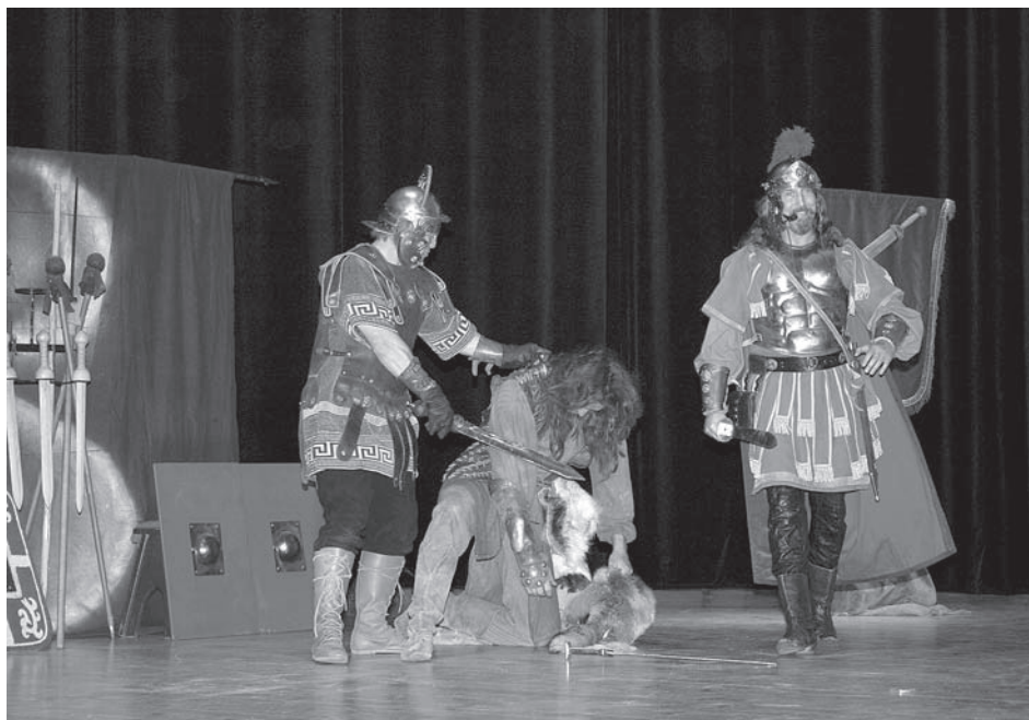
Zámeckému sálu o muzejní noci vládli římské vojáky urputně bojující s germánskými kmeny...

Do archeologické expozice „Věk lovců a mamutů“ v Dolních Věstonicích je dlouhodobě vypůjčen rozsáhlý soubor sbírkových předmětů z Archeologického ústavu AV ČR Brno a jeden sbírkový předmět z Národního muzea v Praze.