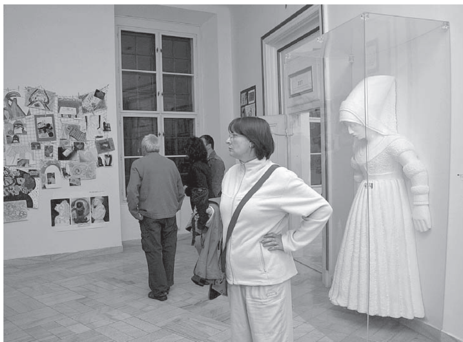
Váženími hosty muzejní noci byly i bílé pani...