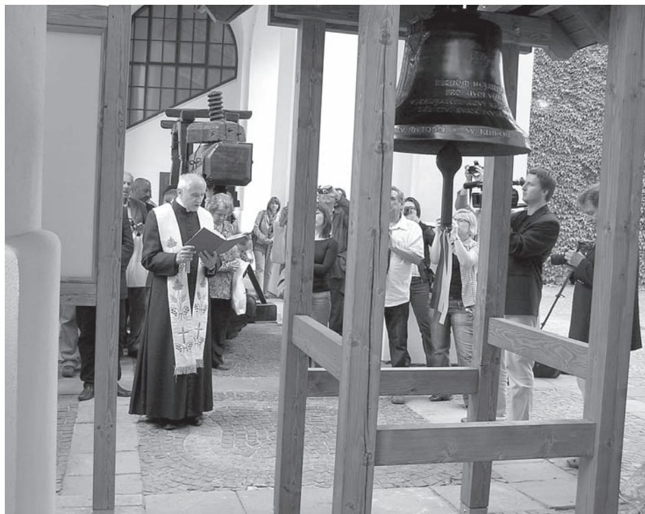
Stežka svobody, připomínající osudy těch, kteří se pokoušeli uprchnout před komunistickým režimem, začíná na zámeckém nádvoří úvodním panelem a zvoničkou se symbolickým Zvonem svobody

Pod dlažbou schodiště východní terasy byla poškozena izolace proti vodě, čímž docházelo k jejímu protékání do fasády a v důsledku následného promáčení začaly odpadávat kusy fasádní omítky. Kamenné schodiště bylo utěsněno a přespárováno s následným nástřikem