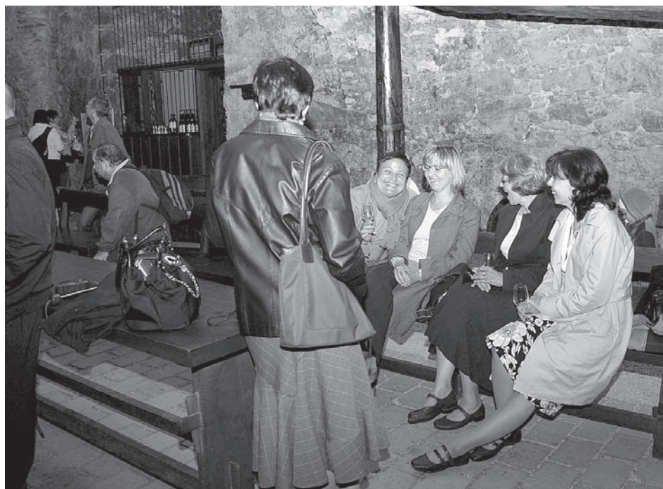
V zámeckém sklepě končí muzejní noc vždy vesele, s vínem a s návštěvníkem z minulosti, s nímž si připijeme na dobrou budoucnost