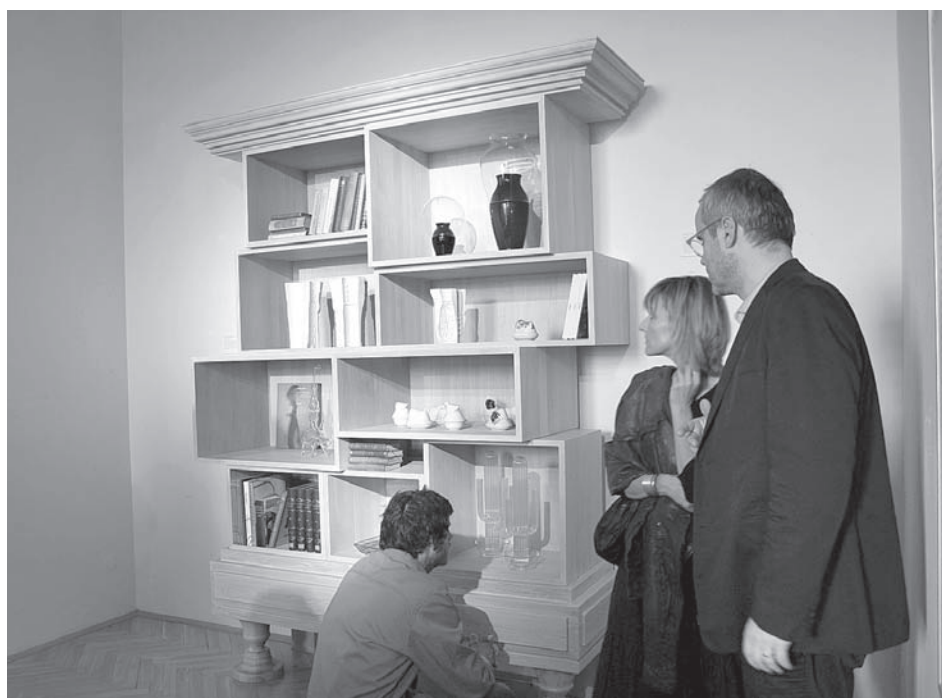
Křehký Mikulov – první festival art designu ve střední Evropě. Projekt nabídl sérii výstav současného designu českých i světových tvůrců a přivedl do muzejních sálů umělce velkých jmen