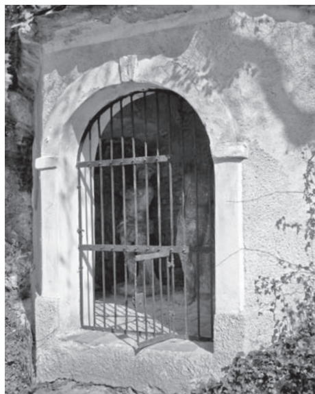
Kaplička č. 4, rok 2011