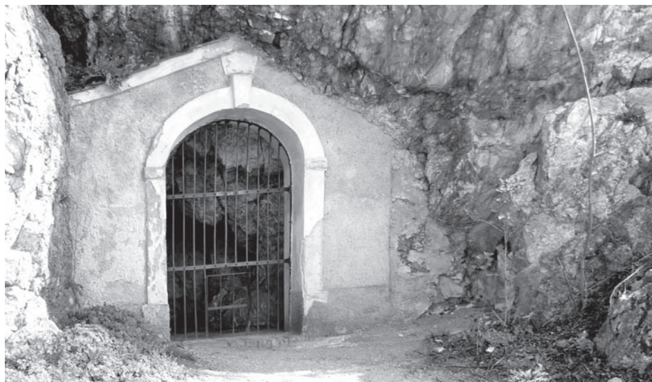
Kaplička č. 3, rok 2011