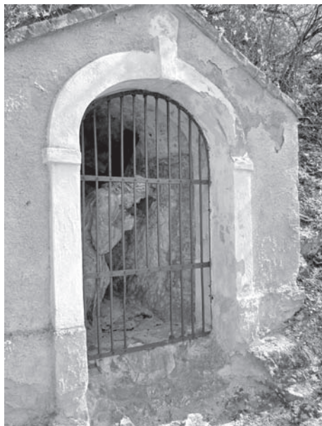
Kaplička č. 7, 2011

Krista modlícího se v zahradě, dále Krista bičovaného, Krista korunovaného [trnovou korunou – pozn. autora], potom Krista, kterak si z něj tropí posměch, dále Krista nesoucího kříž, na Svatém kopečku Krista ukřižovaného, o kus dál naproti Krista mrtvého, oplakávaného blahoslavenou Pannou Marií, a nakonec Boží hrob. 14 Tomuto popisu odpovídá ikonografická výzdoba kapliček nesoucích v současnosti čísla 2 (Kristus v Getsemanské zahradě), 4 (Bičování), 5 (Korunovace – nasazení trnové koruny), 6 (scéna Posmívání), 7 (Kristus nesoucí kříž), 11 (Ukřižování – ovšem dnešní malířská výzdoba je podstatně mladší), 12 (Oplakávání Krista Pannou Marií – dnes již tato kaple žádnou sochařskou výzdobu nemá) 15 a kaple Božího hrobu. Dochované sochy pocházejí dle Bohumila Samka z doby kolem roku 1700 a jsou dílem několika autorů. 16 S ohledem na to, co bylo řečeno výše, by však některé mohly být i o půl století starší. Zároveň je však několik kaplí prokazatelně mladších než jejich dekorace, což znamená, že se sochy ze svých původních kapliček stěhovaly. Přehledně je vztah domnělé původnosti kapliček a jejich sochařské výzdoby zachycen v tabulce. 17