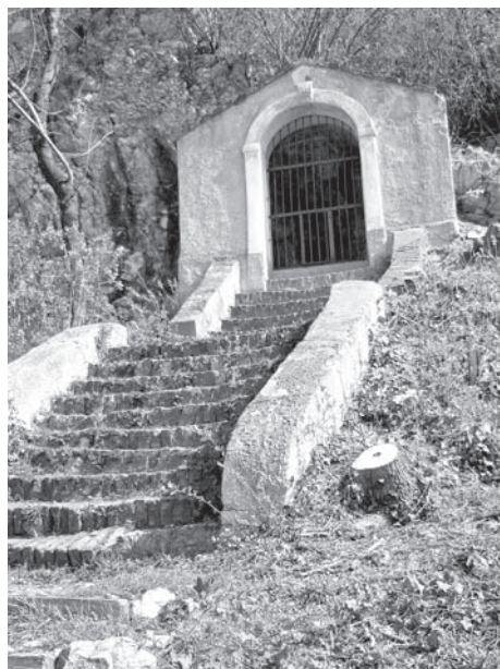
Kaplička č. 2, rok 2011

Dle literatury a pramenů se na vrchu Tanzberg, jak znělo původní jméno dnešního Svatého kopečku, „ zejména prvního května “, 2 o slunovratech a jindy 3 měly odehrávat taneční obřady, spojené možná s kulty plodnosti a vegetace, jak by napovídalo i charakterizování rituálů slovem „ bakchanálie “. 4 Při slavnostech se údajně nevázaně hodovalo a za doprovodu hudebních nástrojů tančilo 5 – odtud název vrchu Taneční hora . Velmi skrovné záznamy o těchto rituálech lze však interpretovat rovněž tak, že mohly být pouze produktem