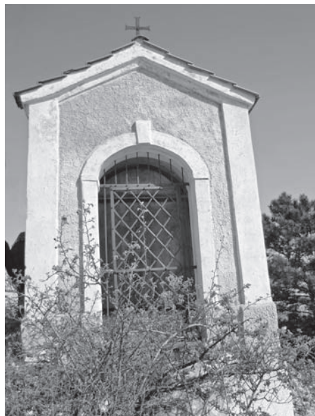
Kaplička č. 9, 2011

Zároveň je však jisté, že pokud nepochází ani jedna ze sokulptur z třicátých let 17. století, nelze o sochách, které můžeme dodnes obdivovat, tvrdit, že jsou původní, a to jednoduše proto, že musely nahradit ještě původnější soubor, jež uvádí urbář a o němž podrobněji hovoří i Zpráva . Jako velmi pravděpodobné se mi jeví, že zde máme co dělat se sochami, jež vznikly minimálně ve dvou fázích: některé už ve třicátých letech na objednávku Františka z Dietrichsteina, další potom kolem roku 1700, možná však i o několik desetiletí dříve (srov. dále). Jestliže sochy, jež vydržely, odpovídají také Zprávě , nemusí to pochopitelně ještě znamenat, že všechny pocházejí z třicátých let 17. století; nicméně se mi zdá divné, že by ani jedna z původních soch nepřečkala do konce 17. století, a byly tak nahrazeny úplně všechny. Stálo by tedy snad za to provést ještě jednou jejich důkladnou umělecko-historickou analýzu.