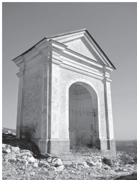
Kaplička č. 10, 2011