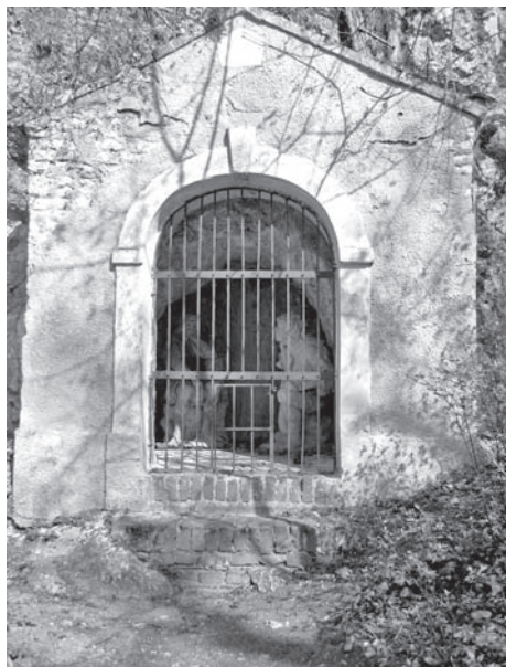
Kaplička č. 6, 2011