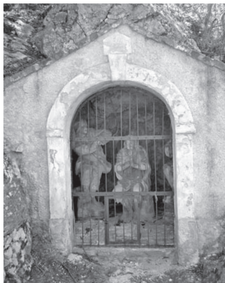
Kaplička č. 5, 2011

později vytvořené tradice. Nevíme ostatně přesně, odkdy byl pozdější Svatý kopeček znám jako Tanzberg; první známá písemná zmínka v pramenech pochází někdy z třicátých nebo čtyřicátých let 17. století. 6 Ať tak či onak, kardinál František z Dietrichsteina se po