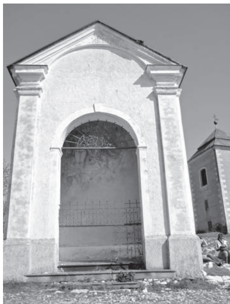
Kaplička č. 11, 2011