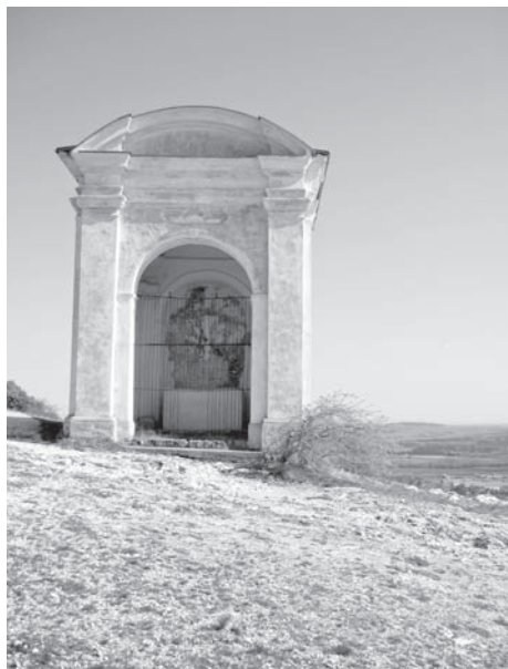
Kaplička č. 8, 2011