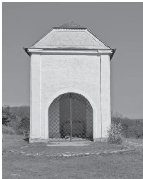
Kaplička č. 12, 2011