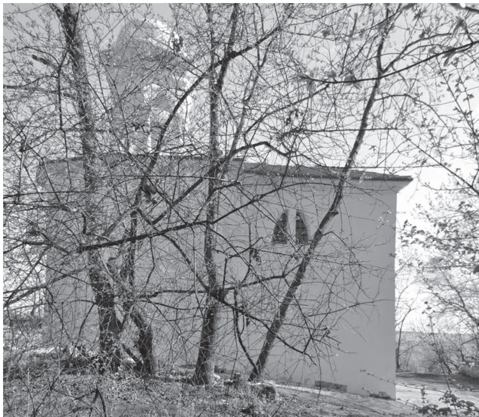
Kaple Božího hrobu, 2011