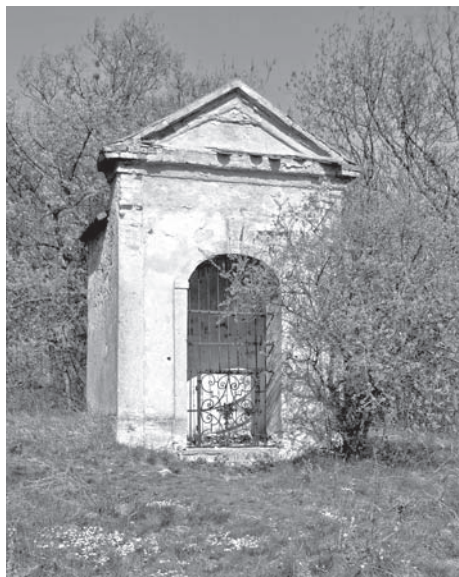
Kaplička č. 14, 2011

našly zřejmě své místo v kaplích č. 12 a 13 na rovině za kostelem sv. Šebestiána. Při doplnění na kanonický počet 14 zastavení kaplemi 2–4 tak zřejmě došlo k přesunu některých výjevů tak, aby zůstal zachován jejich logický sled. Zbývají ještě kaple č. 10, mající zvláštní zasvěcení sv. Barboře, a 14, ležící až za Božím hrobem, o jejíž výzdobě se můžeme jen dohadovat, že odpovídala motivu Vzkříšení. Nelze ani vyloučit, že se se sochami hýbalo také během odsvěcení křížové cesty okolo roku 1787 a při rekonstrukci Svatého kopečku v roce 1865. 24