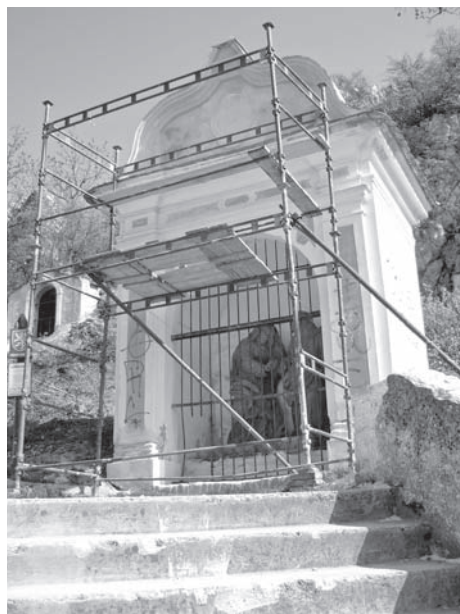
Kaplička č. 1, rok 2011

Svatý kopeček u Mikulova je výraznou krajinnou dominantou, která se může pochlubit také bohatou duchovní historií. Již více než sto padesát let je každoročně o první zářijové neděli (s výjimkou let 1938–1945) 1 cílem poutníků s mikulovskou Černou madonou loretskou; v 17. století na jeho vrchol mířila procesí především v postní době a o velikonočním týdnem. Ještě dříve, než se stal křesťanským poutním místem, býval Svatý kopeček spojován s tajemnými pohanskými rituály.