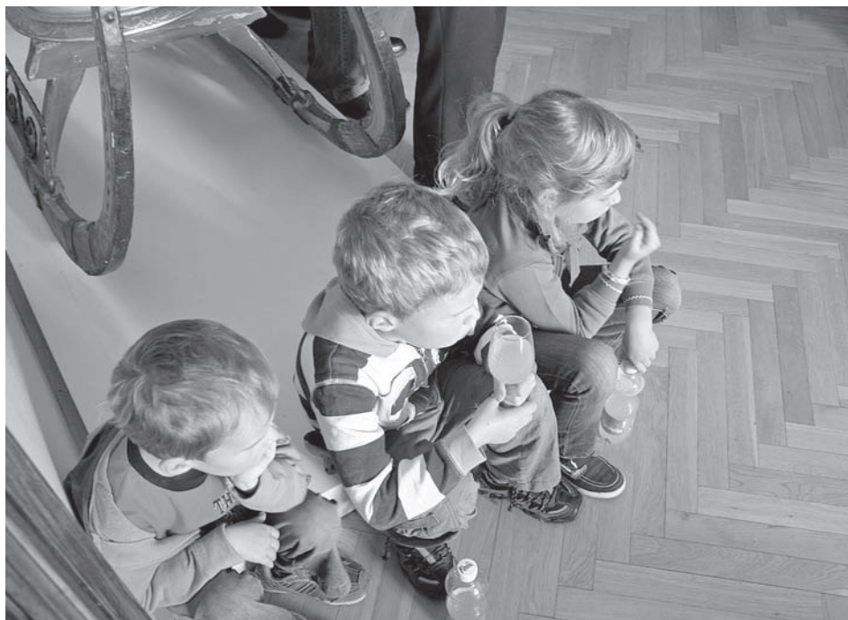
Děti muzejní noc milují...