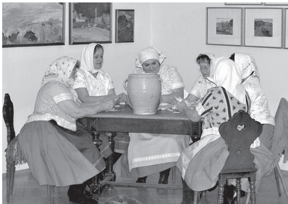
Jak se dralo peří, předvedli v muzeu Pálavští senioři. Večer s přednáškou, koláčky a vínem byl milým ukončením roku