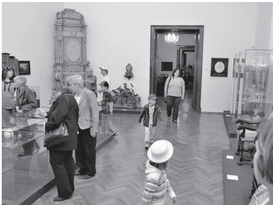
... a často se stávají již průvodci svých rodičů po expozicích