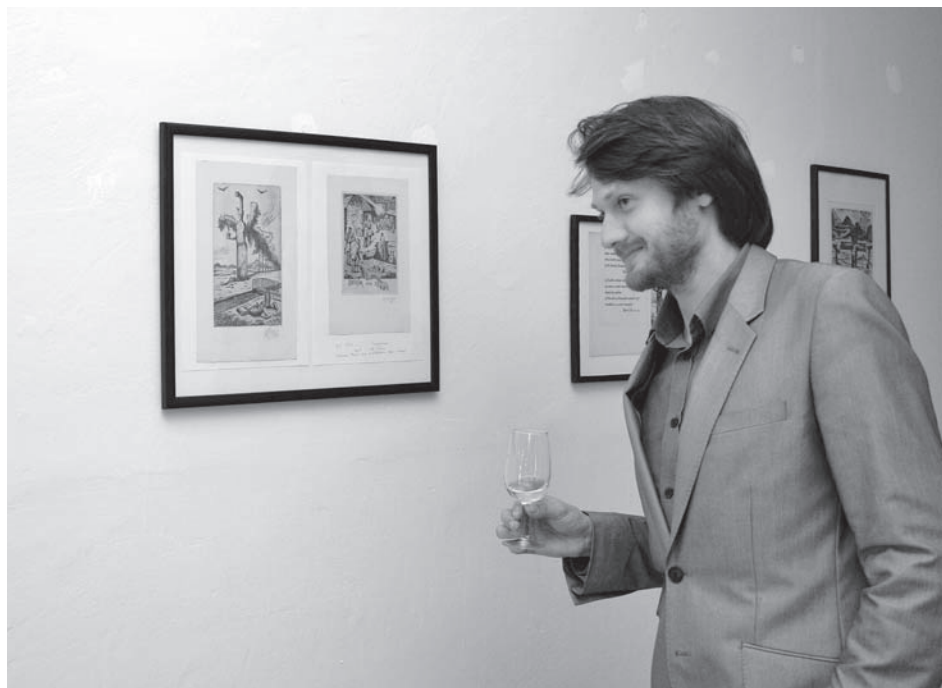
Rozloučení s výstavní sezonou