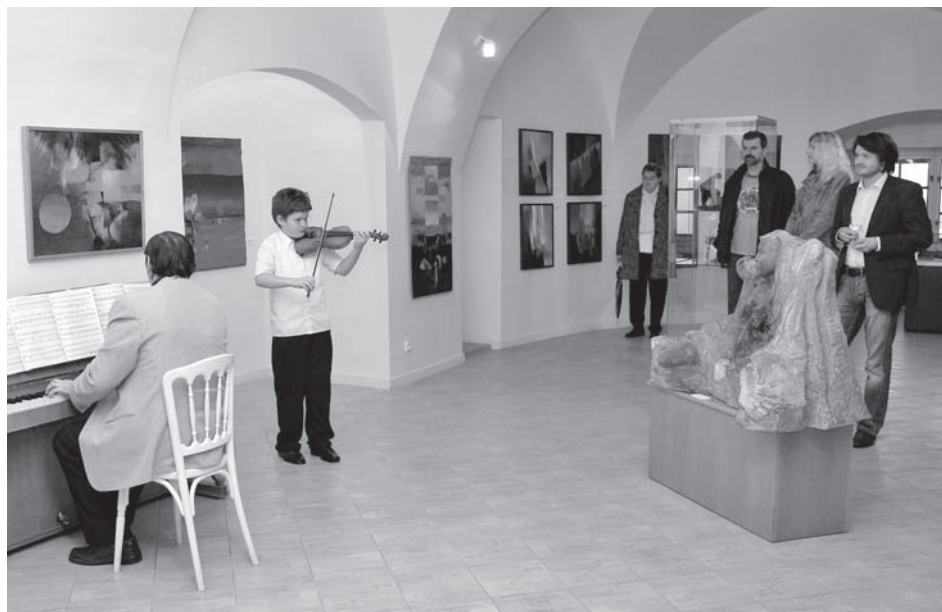
Sdružení Mixtum compositum se v zámeckých prostorách již zabydlelo – tentokrát se představilo výstavou Textilní paleta

Byl proveden řádný zápis změn do Centrální evidence sbírek České republiky při Ministerstvu kultury ČR.