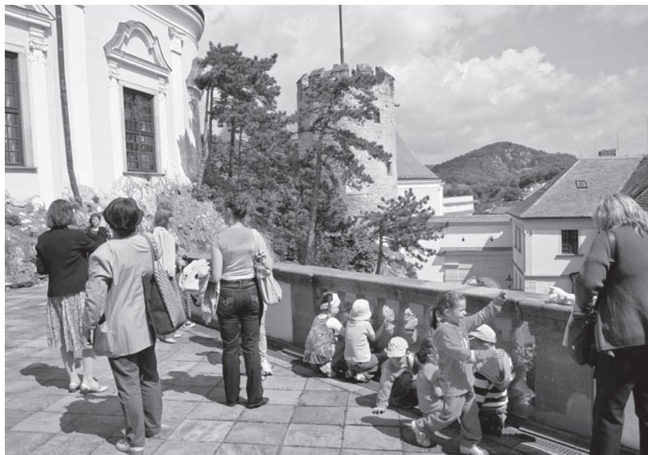
Pro návštěvníky zahradní slavnosti jsou zajímavé i pohledy na místa a z míst, která jindy neuvidí