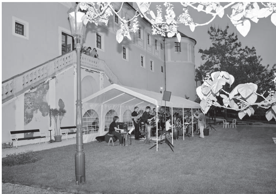
Muzejní noc se nesla na vlně swingu brněnského Junior Big bandu a zasáhla i setmělý Mikulov