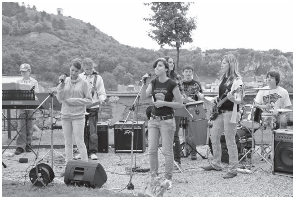
Zahradní slavnost Májového víkendu skvěle doprovodil Junior Band ze Základní umělecké školy Mikulov

Z Moravské galerie v Brně je dlouhodobě zapůjčeno víc než dvě stě sbírkových předmětů, které jsou základem instalace „Od gotiky po empír“ a doplňují též expozici „Galerie Dietrichstein“. Do této expozice byl také zapůjčen významný soubor předmětů od Mercedes Dietrichstein. Do archeologické expozice „Věk lovců a mamutů“ v Dolních Věstonicích je dlouhodobě zapůjčen rozsáhlý soubor sbírkových předmětů z Archeologického ústavu AV ČR Brno a jeden sbírkový předmět z Národního muzea v Praze. Do expozice „Mikulov a moravští Židé“ umístěné v mikulovské synagoze byly zapůjčeny předměty jednak z Židovského muzea v Praze, jednak ze Židovské obce Brno.