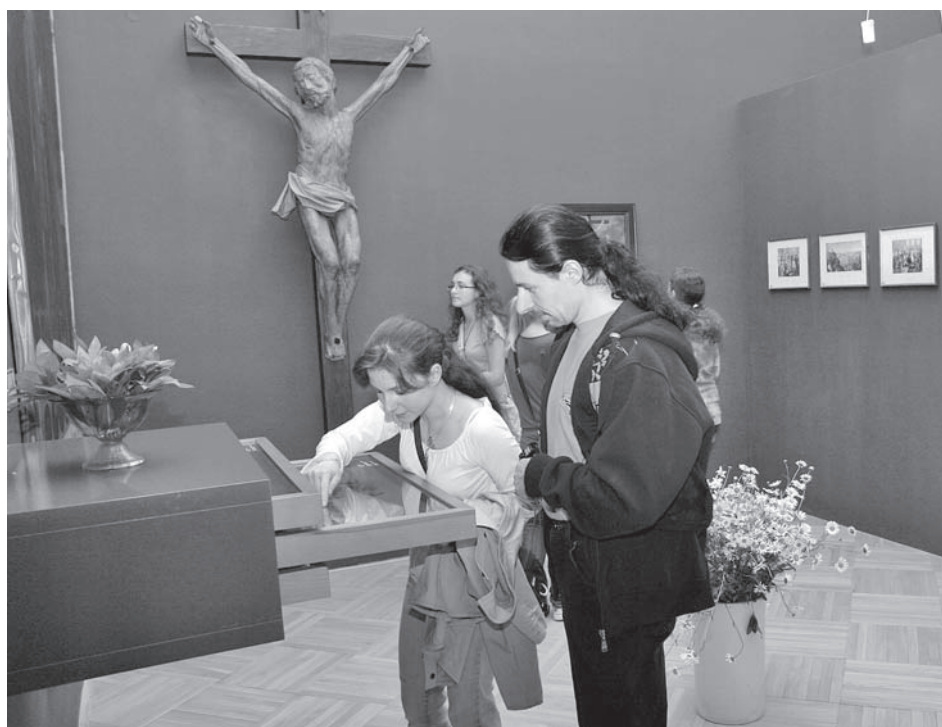
Volný pohyb po expozicích při muzejní noci konečně umožní vše si v klidu prohlédnout a pročíst