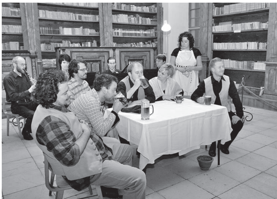
Hororová miniopera Mluvící dobytek, Ensemble opera diversa a zámecká knihovna – úspěch zaručen