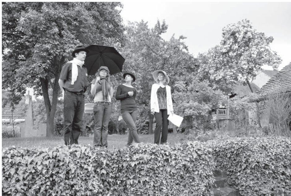
Čtení z dopisů bratří Mrštíků v Divákách v podání studentů Kabinetu divadelních studií při Májovém víkendu pěkně zmoklo, což však návštěvníkům nevadilo