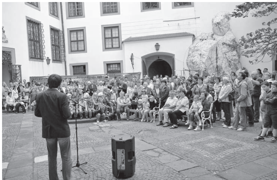
Příjemné májové počasí, zástupy lidí na nádvoří, slavnostní fanfáry – to byl začátek šesté muzejní noci v mikulovském muzeu

Roční revizí prošlo celkem 14 462 inventárních čísel, které pokryly 24 922 sbírkových předmětů. Namátkovou kontrolu evidence a stavu sbírkových předmětů inventarizovaných v roce 2010 provedla inventarizační komise v lednu 2011. Nezaznamenala žádné nedostatky.