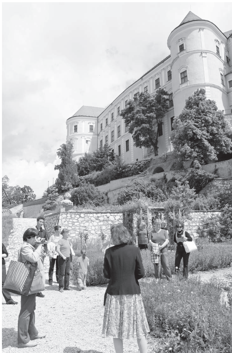
Zahradní slavnost - to je především májová rozkvetlá zahrada pod sluncem zalitým zámek