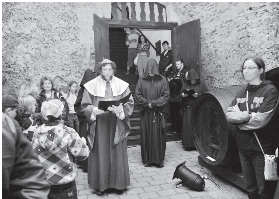
S návštěvníky muzea se tentokrát rozloučil muž nad jiné povoláný, až ze 17. století přišel pozdravit své poddané sám kardinál František Ditrichstein. I když jeho řeč byla poměrně současná...