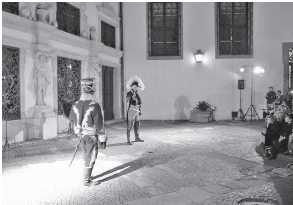
K programu muzejní noci již tradičně patří historické postavy, nákladné oděvy, zbroj, umění šermu i vznešeného chování