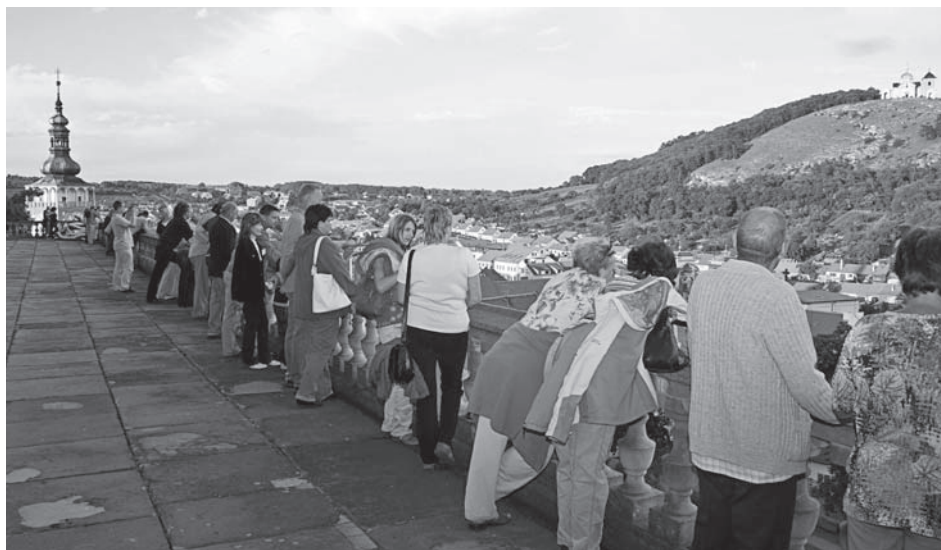
Při pohledu ze zámeckých teras je zřejmé, proč pobělohorský vládce Moravy kardinál František Dietrichstein učinil Mikulov svým sídlem.

oprava zabezpečovacího a bezpečnostního systému. Ve všech expozicích byl instalován elektronický protipožární systém.