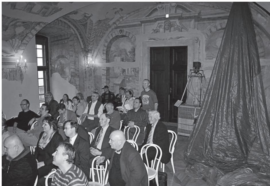
Konference při příležitosti výročí pádu železné opony představila kromě jiného i „dopravní prostředky“ k cestě za hranici – zde horkovzdušný balón.