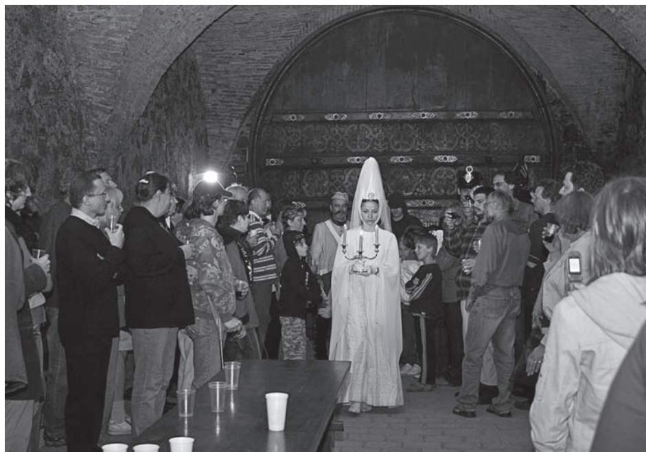
Bílá paní odchází – zámek za chvíli utichne a oddechne si od Muzejní noci. Na rok...

Expozice zámecké knihovny byla doplněna novými texty a popiskami s informacemi o vybavení hlavního sálu.