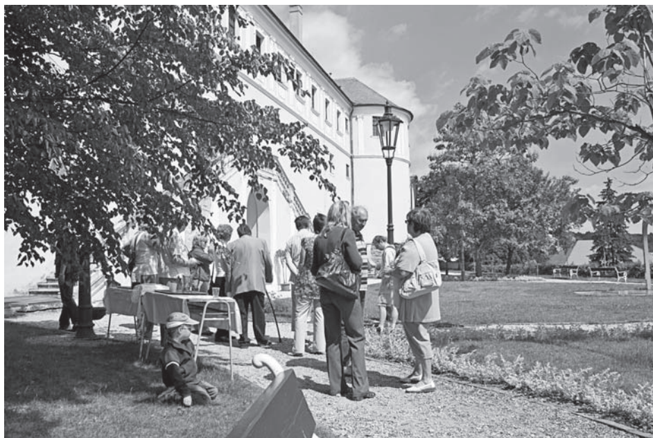
Zahradní slavnost v zámecké zahradě s májovým sluníčkem, vínem ze zámeckého sklepa a povídáním botanického muzea neměla jedinou chybičku.