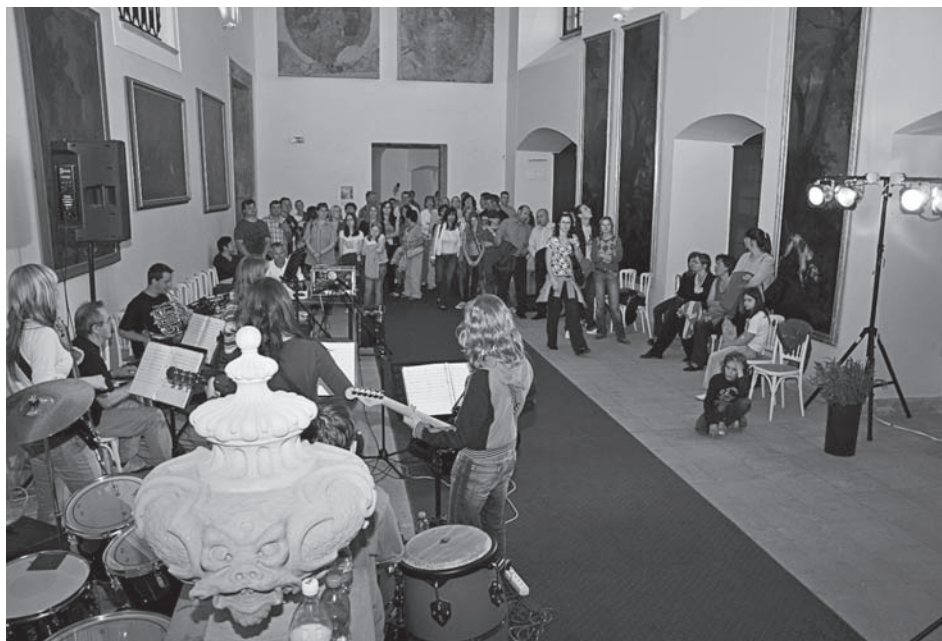
I v Nástupním sále zněla o Muzejní noci hudba – Junior band z hudební školy z podzámčí.

V roce 2009 získalo muzeum grant z Ministerstva kultury ČR na digitalizaci týdeníku Nikolsburger Wochenschrift a jeho záznam na mikrofilm. V průběhu roku se podařilo zpracovat ročníky 1926–1930. Celkové náklady projektu činily 100 000 Kč. V rámci tohoto grantu byl na server Regionálního muzea v Mikulově nainstalován systém Kramerius,