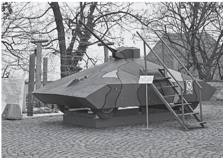
Toto obrněné monstrum, zapůjčené z Muzea Policie ČR, mělo sloužit k násilnému proniknutí přes ostnatý drát. Neúspěšně.