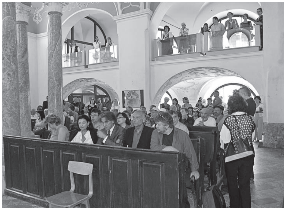
Imponující prostor synagogy a výstava Svědci doby na židovském hřbitově v Mikulově

TRAMPOTA, F. – KUBÍN, P. 2009: Stálá výstava Římané a Germáni v kraji pod Pálavou. Malovaný kraj, roč. XLV, č. 2, s. 31.