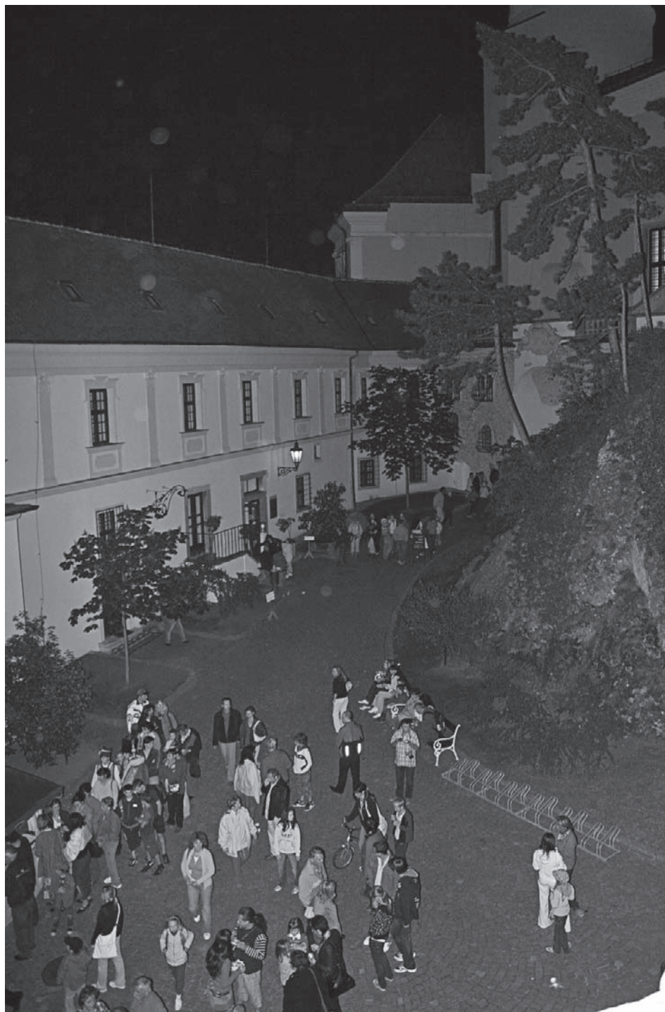
Teplá májová noc a čekání na bílou paní