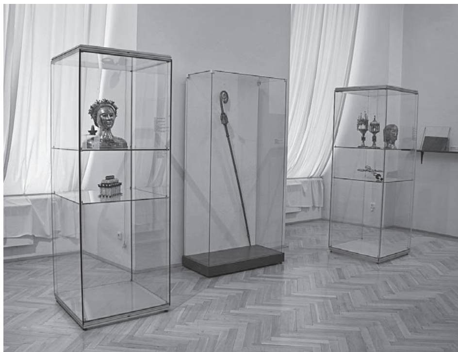
Skvosty italské gotiky - stěžejní výstava mikulovského muzea roku 2009