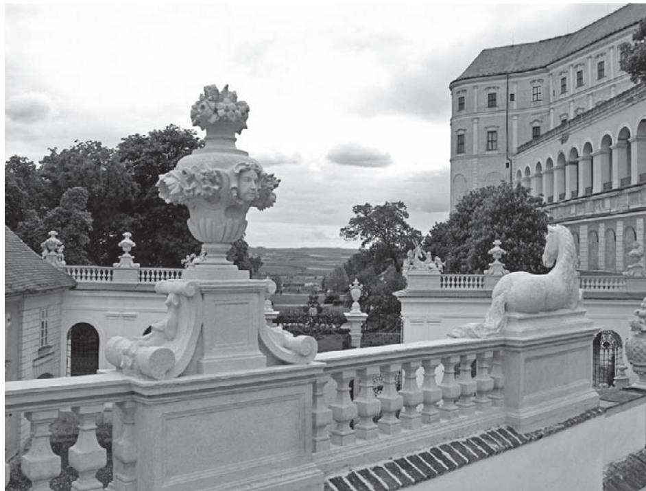
Mikulovský zámek – sídlo Regionálního muzea v Mikulově

V Regionálním muzeu v Mikulově v roce 2009 zněly světové jazyky častěji než v jiných letech a zámek ve svých zdech hostil více významných osobností evropské politické scény než jindy. Význačné události, které představily Mikulov a muzeum i evropské veřejnosti, stály hodně úsilí, avšak neubraly nic z kvality ani kvantity všech sezonních muzejních akcí. Zámecká okna zářila do pozdních hodin nejednu noc a naše oblíbená bílá paní si tento rok příliš klidu neužila.