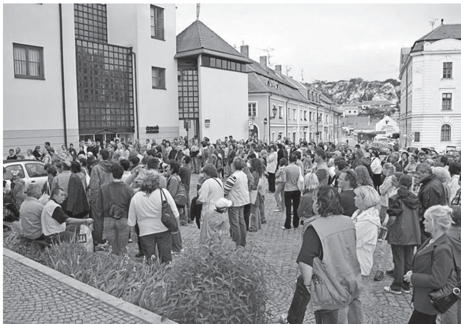
Začátek muzejní noci – páteční odpoledne před schody k bastionu veřejnosti nově otevřenému

entomologie, zoologie) byly doplňovány ve sběrné oblasti regionu sběrem a fotodokumentací. Fotodokumentací biotopů, rostlin a živočichů (sbírka negativy a diapositivy) bylo získáno 353 snímků.