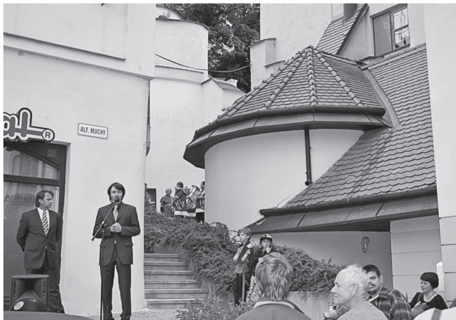
Starosta města a ředitel muzea otvírají bastion spojující město se zámekem – náměstí se zámeckým parkem.

setkání. Plánovaný finanční zisk v této kapitole muzejní činnosti byl dosažen i přes obavy z předpokládaného útlumu akcí vyvolaného všeobecnou hospodářskou krizí.