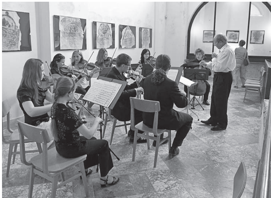
Vernisáže v synagoze pravidelně rozezní hudba v podání komorního orchestru zdejší umělecké školy.