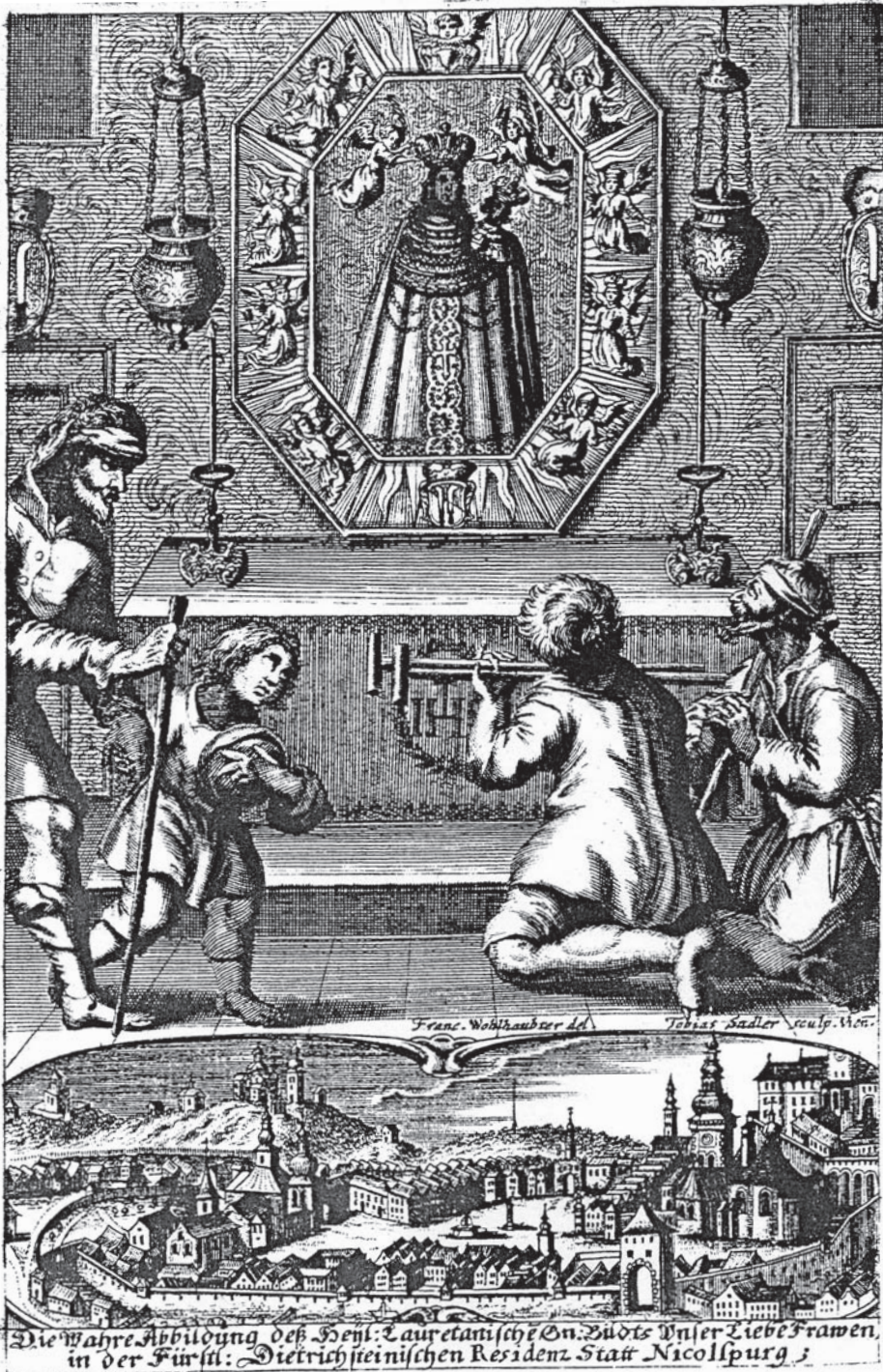
Sadlerův přepis Wohlhauberovy veduty, 1675