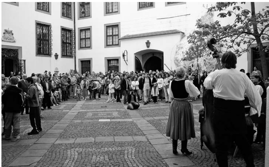
Muzejní noc se stala jednou z významných mikulovských kulturních akcí.

I v roce 2007 muzeum pokračovalo v dlouhodobě úspěšné spolupráci s mnoha organizacemi a institucemi při přípravě akcí, které jsou součástí nejen mikulovského kulturního života, ale svým významem a ohlasem jej přesahují. Jedná se především o Mezinárodní kyrtarový festival, Mikulovské výtvarné sympozium „dílna“ a celou řadu dalších akcí, jakými jsou například koncerty a vystoupení národopisného souboru Pálava, komorního orchestru Collegium Magistrorum a pěveckého sboru Virtuosi di Mikulov. Mikulovský zámek hostil také návštěvníky mnoha akcí spojených s vínem a vinařstvím, které k Mikulovu neodmyslitelně patří. Pracovníci muzea se dále organizačně podíleli na uspořádání dvou mezinárodních konferencí.