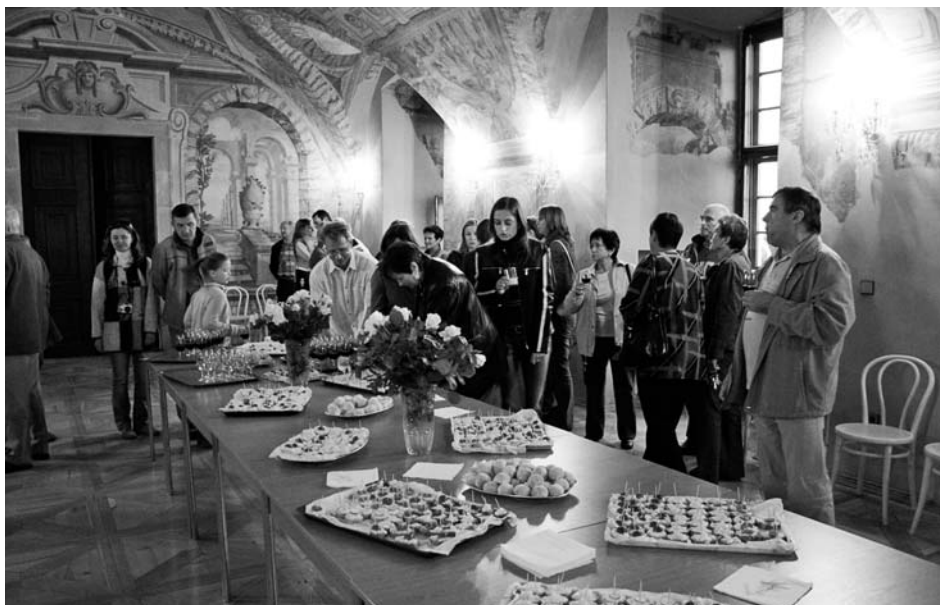
Návštěvníky Muzejní noci čekalo příjemné překvapení v podobě občerstvení v zámecké sale terreně...