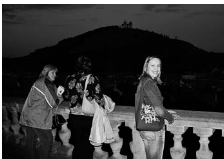
... a příjemné osvěžení s nočními výhledy ze zámeckých teras.

Mikulov, financovaného z programu Iniciativy společenství INTERREG III A Česká republika-Rakousko