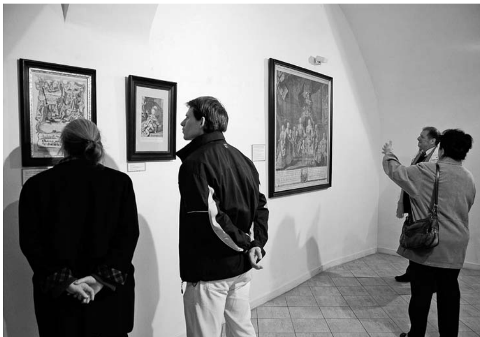
Grafické listy z 18. a 19. století z historické dietrichsteinské sbírky jsou chloubou muzea.