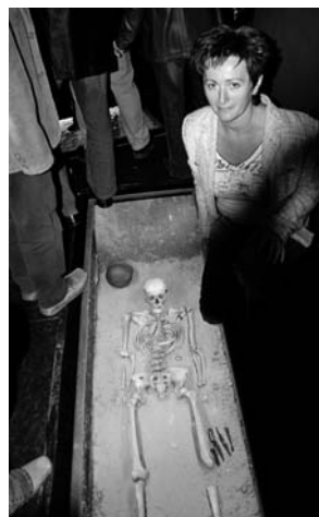
Expozice Římané a Germáni v kraji pod Pálavou.