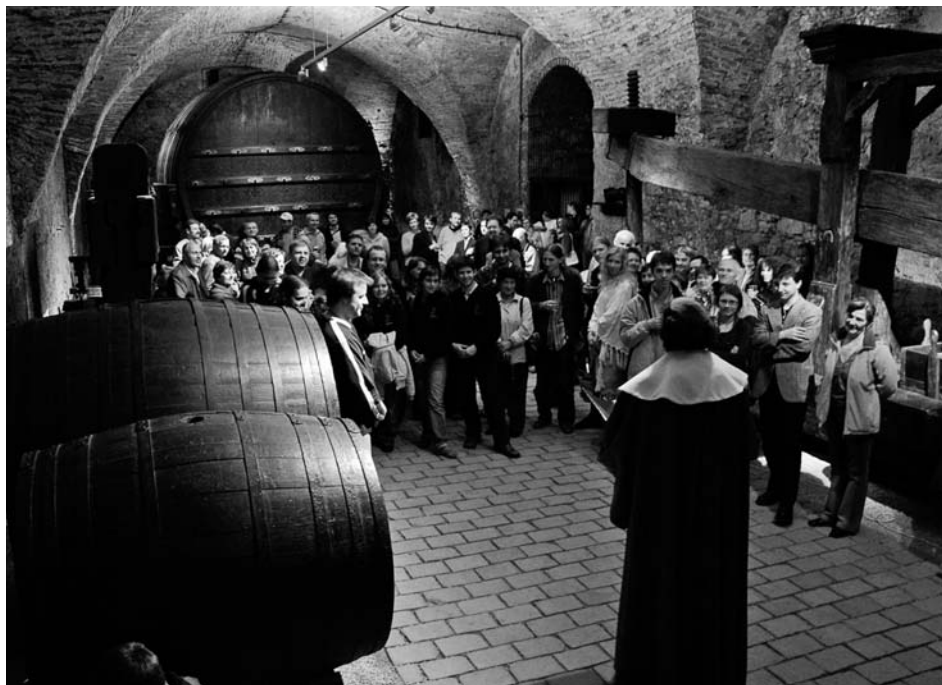
Muzejní noc je již tradičně ukončena v zámeckém sklepení půlnočním přípitkem. S návštěvníky se přišel rozloučit kardinál František z Dietrichsteina...