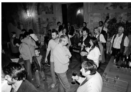
... a příjemná zábava za doprovodu cimbalové muziky