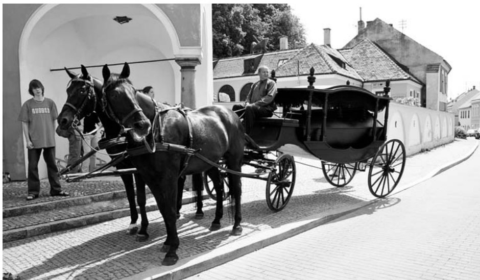
Spolek přátel židovské kultury v Mikulově představil při zahájení výstavní sezony v synagoze pohřební vůz židovského bratrstva ze Senice, který se stal součástí expozice na židovském hřbitově, spravované spolkem.