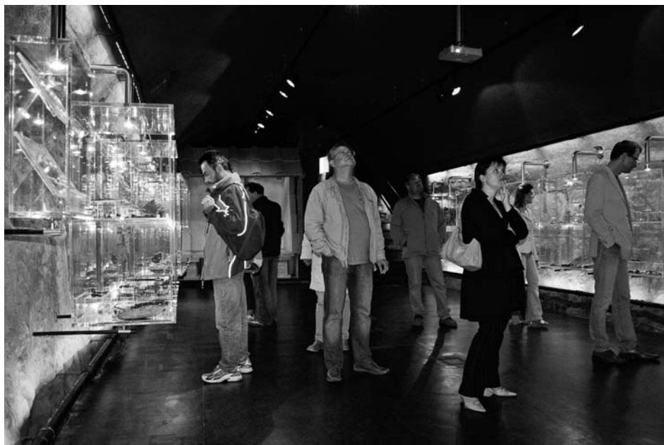
Expozice Římané a Germáni v kraji pod Pálavou.