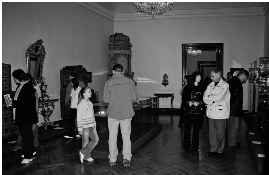
Prohlídka expozičních sálů v průběhu Muzejní noci má své zvláštní kouzlo, přitáhne každoročně víc než dvě stovky návštěvníků.

Byly provedeny úpravy a repase expozice „Verbo et exemplo“, umístěné na knížecí ořatoři kostela sv. Václava, která byla připravena ve spolupráci se Spolkem přátel Mikulova. Kromě běžné přípravy celé expozice na novou návštěvní sezónu bylo zapotřebí nových úprav výstavního prostoru s ohledem na zahájení oprav interiéru kostela sv. Václava.