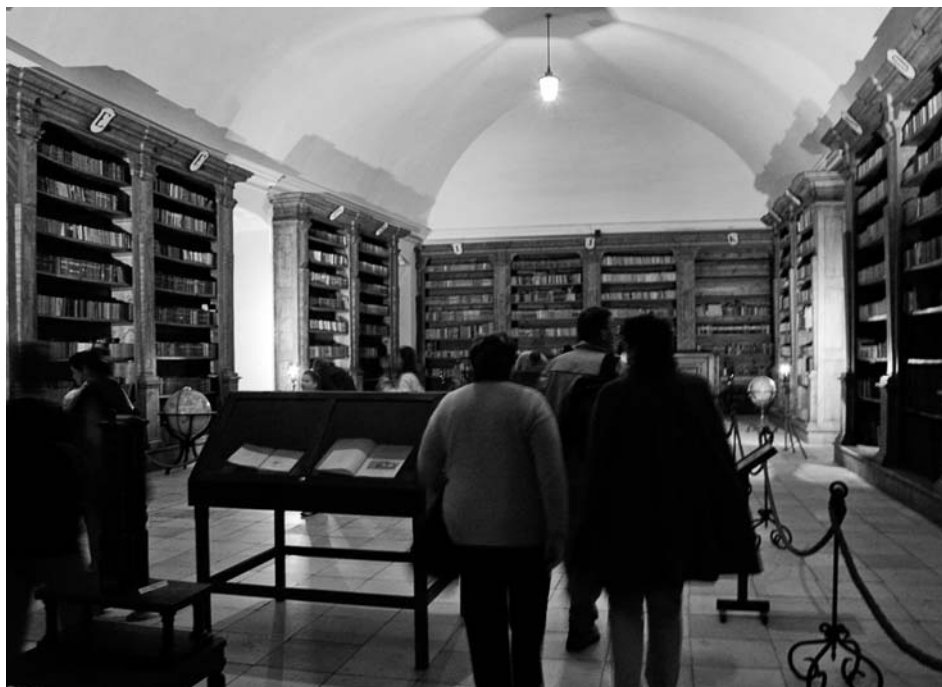
Muzejní noc – zámecká knihovna vypadá v noci úplně jinak...