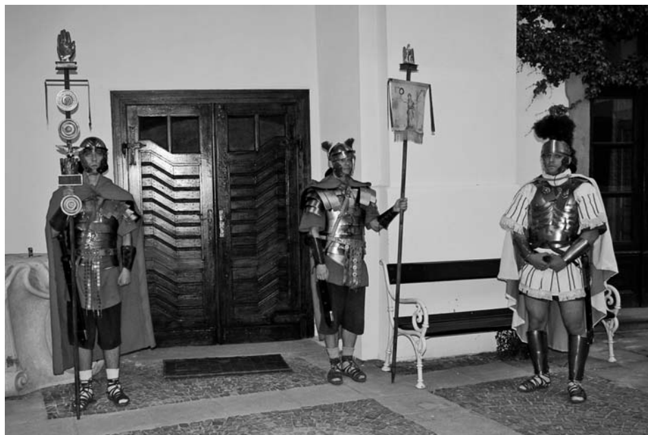
Vernisáž jedinečné muzejní expozice Římané a Germáni v kraji pod Pálavou byla zahájena stylově.