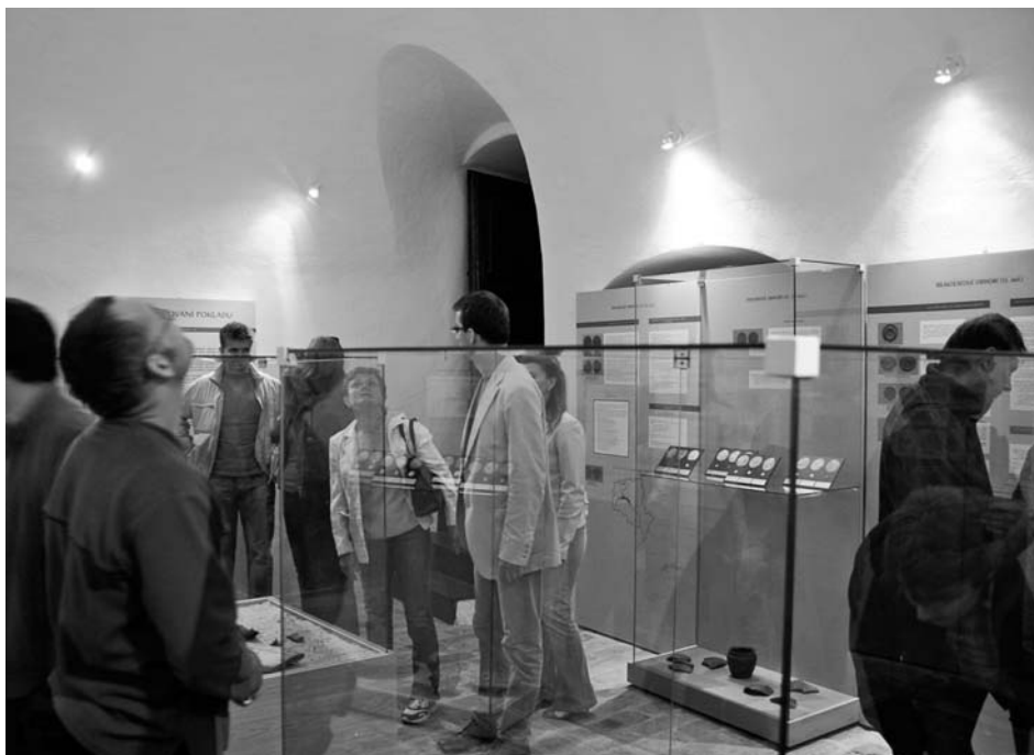
Výstava „Klíč k určování pokladů“ opět přivedla do prostor Udírenské věže milovníky starých mincí.