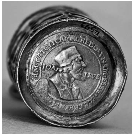
Vyobrazení 5: Dno mincovního pohárku s portrétem Mistra Jana Husa.

Je zajímavé, že mikulovské regionální muzeum vlastní stříbrný mincovní pohár, který byl v poslední době kladen do souvislosti s mikulovskou reformací (srov. vyobrazení 3–5). Válcový, lehce kónický pohár (výška 115 mm, vrchní průměr cca 60 mm, dolní průměr cca 50 mm) je zhotoven ze stříbrného plechu, který je v pěti řadách probíjen vždy osmi otvory, osazenými antickými stříbrnými mincemi (z nichž jedna v horní řadě chybí). Mince jsou vzhledem ke svému umístění na oblouku poháru směrem ke svému středu lehce zaobleny. Dno nádoby tvoří stříbrná medaile, na jejíž lící straně (obrácené směrem ven) se nachází poprsí Jana Husa a na rubové straně vyobrazení jeho upálení. Horní okraj poháru nese letování provedené dvěma navzájem obtočenými dráty, na spodní straně se nachází vyčnívající kruh stojanu zhotovený ze stříbrného plechu, vydutý vně. Výroba nádoby byla zjevně uskutečněna z rozžhaveného jádra, neboť mince vykazují na vnitřní straně částečné stopy po tavení. Nádoba nenese žádnou dekoraci, puncovní značku nebo nápis. 47 Pohár byl nalezen v roce 1945 na mikulovském zámku (bezprostředně po konci války vyhořelém) a byl při nálezů poznámenán ohněm. Doposud nebylo objasněno, zda byl pohár součástí starého zámeckého inventáře, nebo zda se jedná o vykopávku. V roce 1955 byla nádoba v restaurační dílně Moravské galerie v Brně vyčištěna. 48