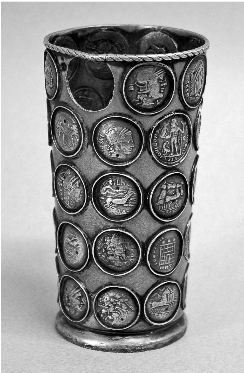
Vyobrazení 3: Mincovní pohárek ze sbírek Regionálního muzea v Mikulově.