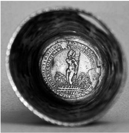
Vyobrazení 4: Vnitřek mincovního pohárku se dnem tvořeným medailí s vyobrazením upálení Mistra Jana Husa.