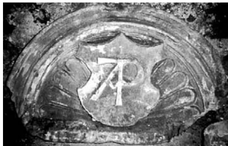
Vyobrazení 2: Architektonický fragment ze druhé čtvrtiny 16. století s iniciálami „AP“ v kryptě mikulovského farního kostela.