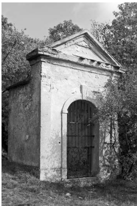
Čtrnácté zastavení křížové cesty.