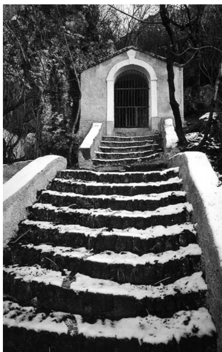
Druhé zastavení křížové cesty.