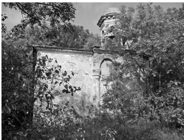
Kaple Božího hrobu bylo na počátku 20. století možné obdivovat zdaleka.