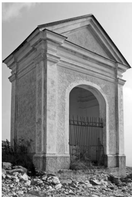
Desáté zastavení křížové cesty.