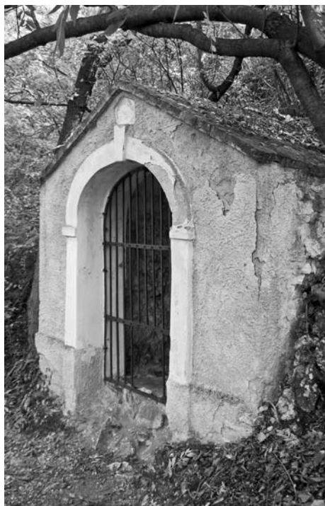
Sedmé zastavení křížové cesty.