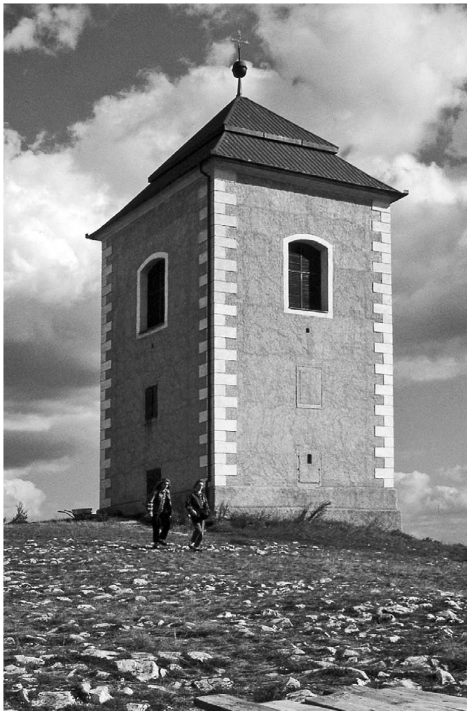
Zvonice (kampanila) na Svatém kopečku. (foto Jan Halady)