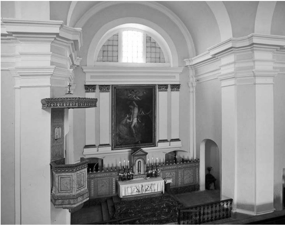
Interiér kaple sv. Šebestiána.

k původnímu cyklu pašijových zastavení z doby kolem roku 1630. Je to dáno zřejmě tím, že tato kaplička leží na samotném úpatí Svatého kopečku, a je tak před očima pozorovatele (stejně jako autora veduty) skryta za okolní zástavbou.