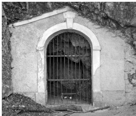
Třetí zastavení křížové cesty.

Také další zastavení patří do souboru šesti tzv. skalních kapliček, které byly postaveny někdy mezi léty 1750–1776. I pro ni platí vše co pro ostatní skalní kapličky – její sochařská výzdoba pochází z doby kolem roku 1700, a je tedy starší než samotná kaplička. Byla sem zřejmě přenesena z některé z původních sedmi kapliček křížové cesty (viz druhé zastavení křížové cesty). Tři ležící kamenné sochy představují Spící apoštoly Petra, Jakuba a Jana, kteří měli v Getsemanské zahradě bdít, zatímco se Ježíš modlil. Svůj úkol, jak známo, však učedníci nesplnili, a sochy tří spících apoštolů tak symbolizují němou Ježíšovu výčitku nevděčnému lidstvu.