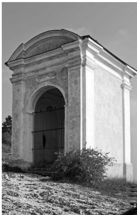
Osmé zastavení křížové cesty.