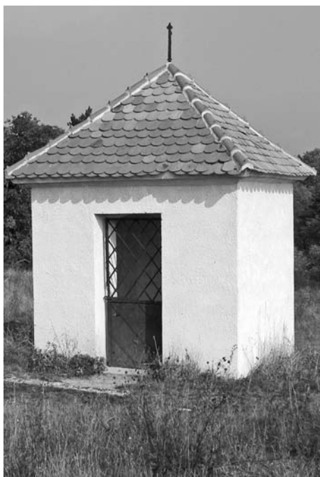
Třinácté zastavení křížové cesty.