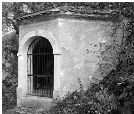
Čtvrté zastavení křížové cesty.