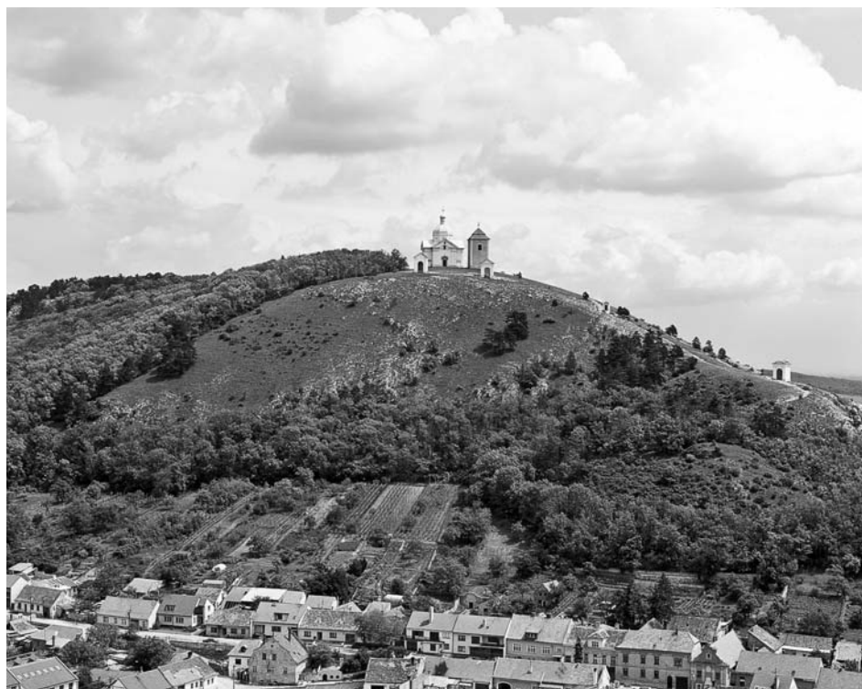
Svatý kopeček je jednou z nejvýraznějších přírodních dominant Mikulova.

Křížová cesta je symbolickým ztvárněním utrpení Ježíše Krista při jeho cestě pod křížem, vedoucí ulicemi Jeruzaléma až na návrší zvané Golgota (Kalvárie), kde byl podle tradice ukřižován. Touha věřících křesťanů následovat Krista nejen symbolicky a v duchovním slova smyslu, ale přímo fyzicky, vedla od samého počátku křesťanství k uctívání míst, kudy v Jeruzalémě Ježíš při své poslední cestě kráčet. Podle legendy stála u zrodu této tradice sama Panna Maria, která místy Kristova utrpení procházela každý den. Různé pokusy o rekonstrukci této posvátné cesty vedly k tomu, že se v průběhu staletí trasa jeruzalémské křížové cesty několikrát změnila a svoji dnešní podobu získala až v 16. století. Také počet zastavení křížové cesty se během let měnil, až se nakonec ustálil na počtu čtrnácti. Popis jednotlivých zastavení vychází nejen z biblického podání celého pašijového příběhu, ale mezi těmito zastaveními nalezneme i taková, která se do kanonického textu nedostala a která pocházejí z apokryfních spisů, popř. pozdějších legendistických zpracování (viz např. šesté zastavení představující Ježíšovo setkání s Veronikou).