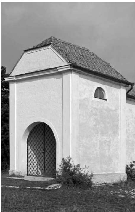
Dvanácté zastavení křížové cesty.