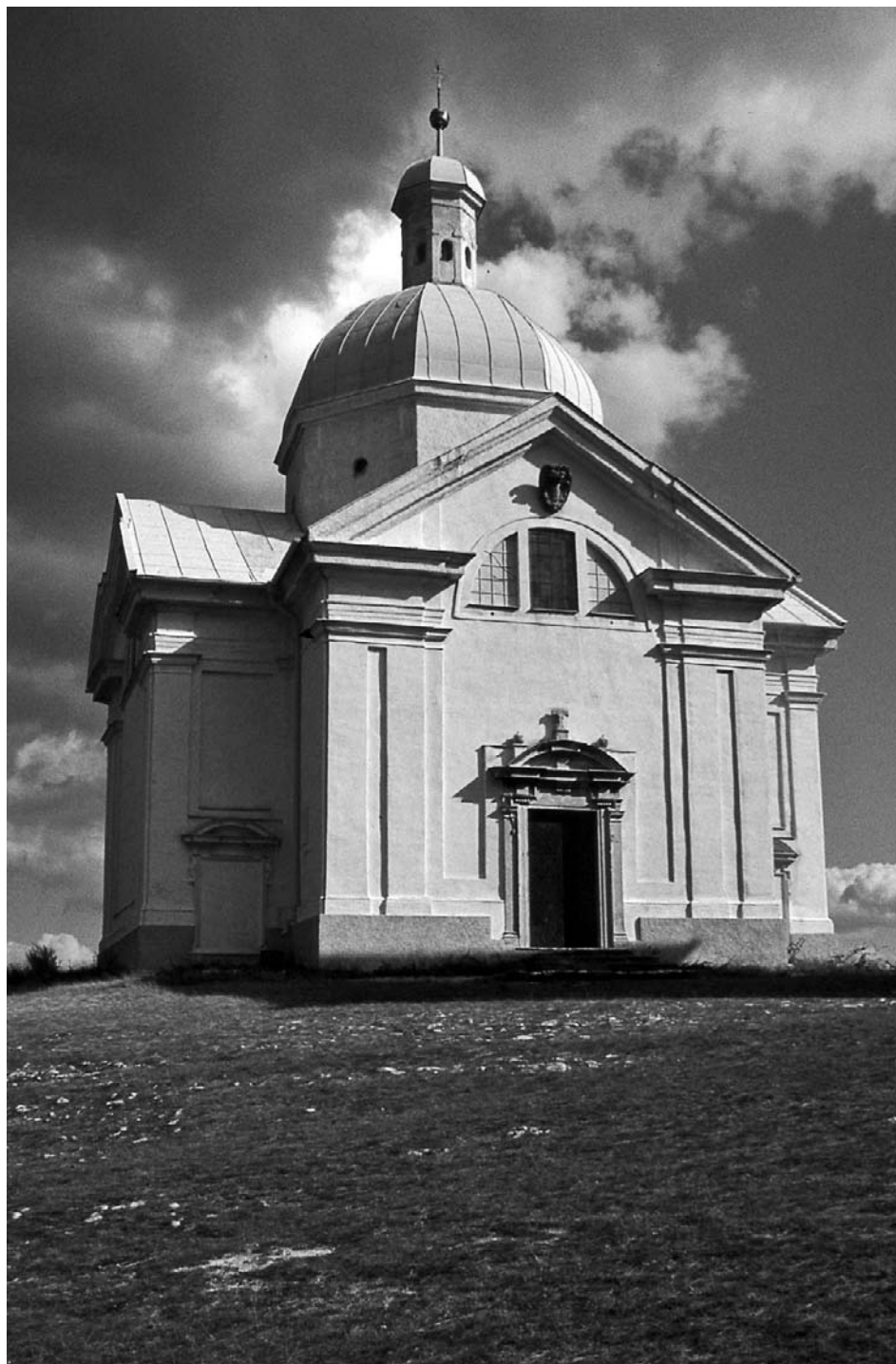
Kaple sv. Šebestiána na vrcholu Svatého kopečku.