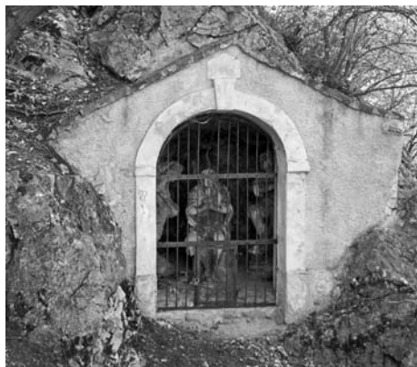
Páté zastavení křížové cesty.