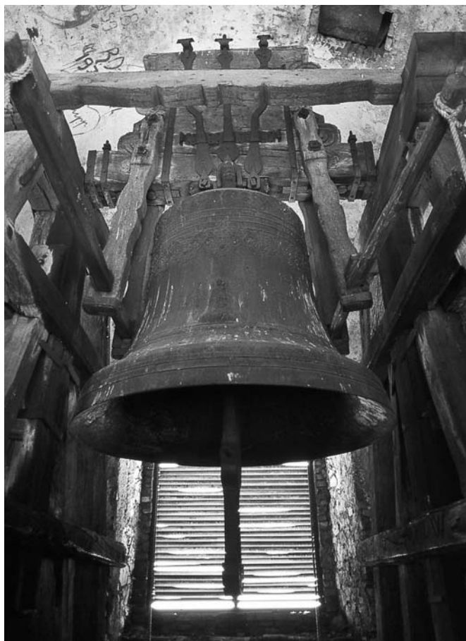
Srdce kampanily – mohutný zvon z roku 1768.

s jeruzalémskými ženami. Tato výzdoba snad pochází z druhé poloviny 18. století, tedy z doby, kdy byl počet kapliček křížové cesty rozšířen na čtrnáct. 17 Je ovšem zajímavé, že kaplička patří do souboru původních sedmi zastavení pocházejících ze 17. století. Měla tedy kdysi jinou výzdobu (snad kamennou sošpulturu v dnešní druhé kapličce?) a teprve po rozšíření křížové cesty dostala současnou dekoraci. Opět se vynořují otázky: proč se autoři dostavby křížové cesty v druhé polovině 18. století rozhodli respektovat již tehdy platné rozvržení motivů křížové cesty až od osmého zastavení?, proč do prvních sedmi kapliček umístili starou výzdobu, která již nové podobě křížové cesty neodpovídala? Podivná kombinace původní ikonografie sedmi zastavení a novějších námětů typických pro čtrnáct zastavení je tak jednou ze zvláštností, které mikulovskou křížovou cestu charakterizují.