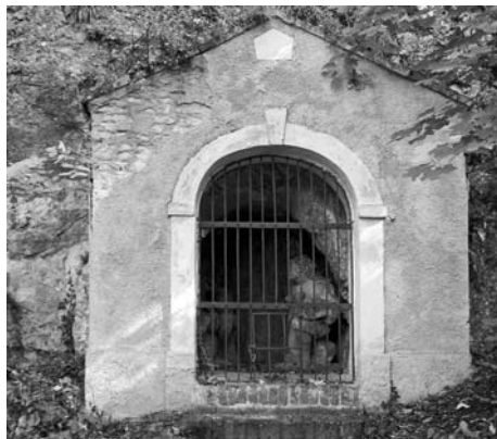
Šesté zastavení křížové cesty.