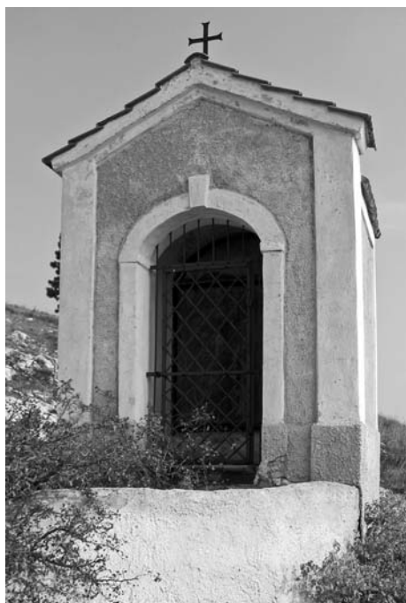
Deváté zastavení křížové cesty.