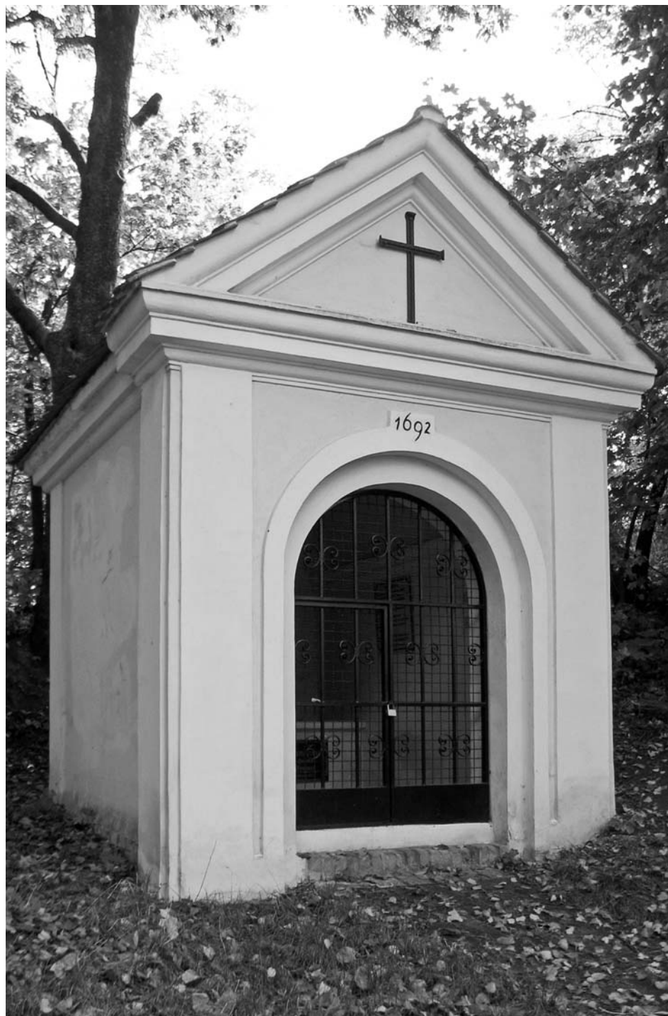
Kaple sv. Rozálie.