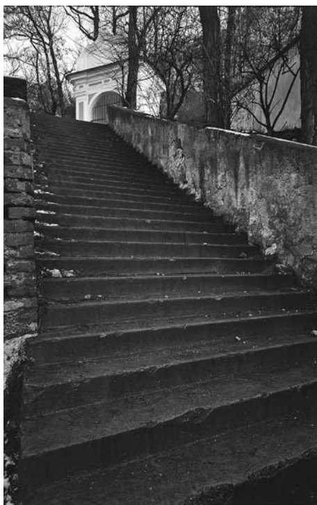
První zastavení křížové cesty.