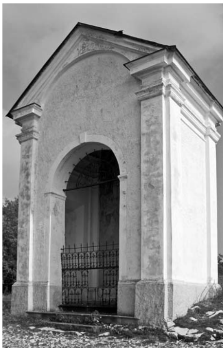
Jedenácté zastavení křížové cesty.